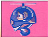
プチコプター(障害物に羽が触れると落ちる)