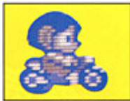
スコバコサイクル(岩をも砕くスーパーバイク)