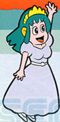
◀ルーニー姫 イグルの婚約者

毎週1,000名、計1万名に、アレックスキッドの“走るカンペン”が当たるよ! くわしくは「アレックスキッドのミラクルワールド」に入っている説明書を読んでネ。