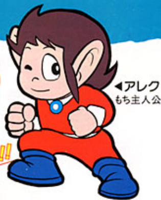
◀アレク もち主人公