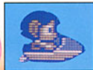
ポート(水上を高速で走れる)