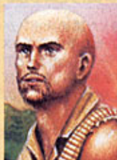
くさんぱつ 昆沙門