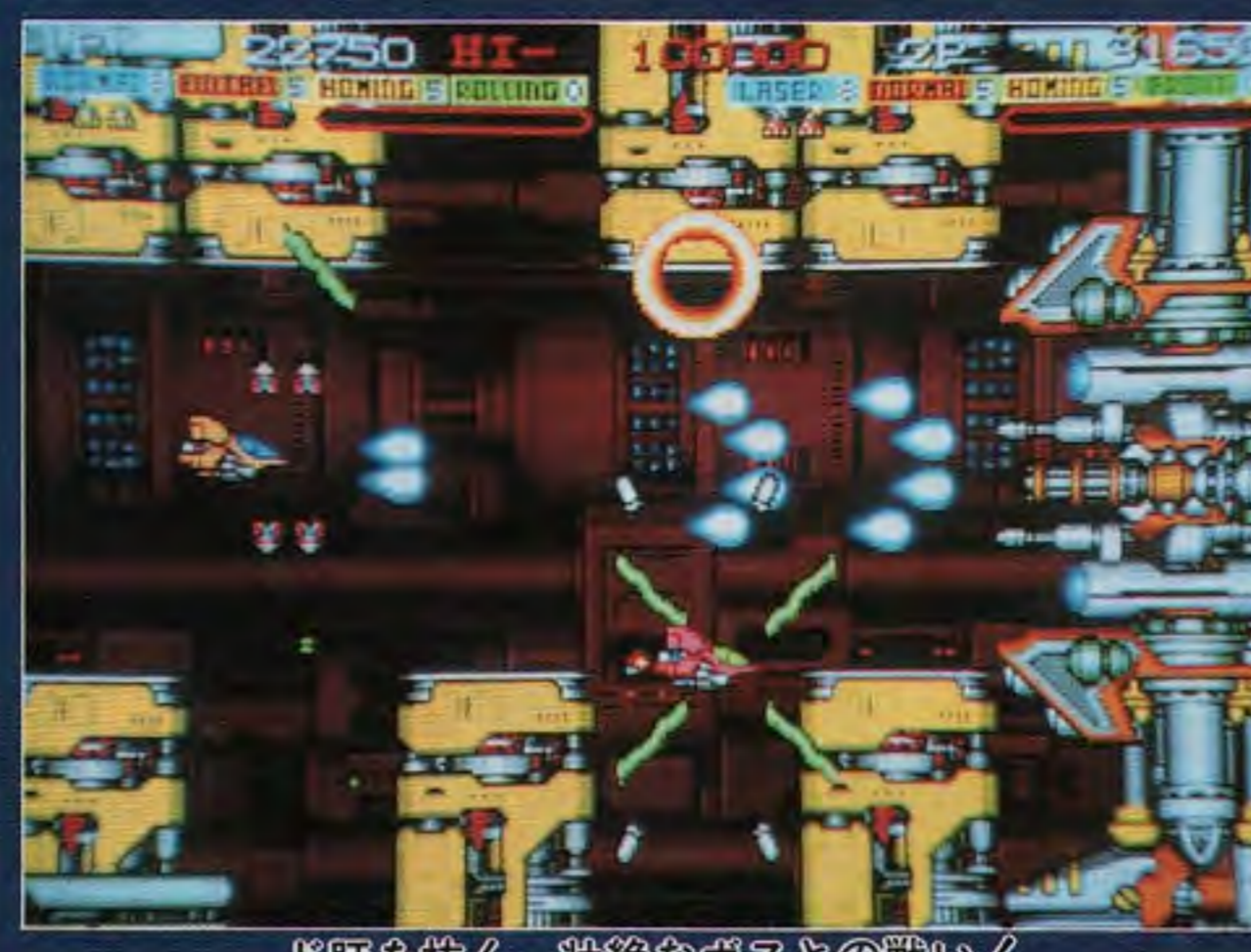
下扉を抜く、絶妙なスとの戦い!