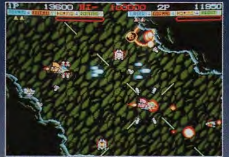
息もつかせぬ多方向スクロール!