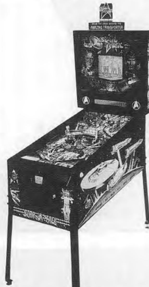
Data East's "Star Trek"

近ごろ評判のよいデータリストUSA社、ボールド部門(データインフォメーション)の新作「スタートレック」は、アメリカの同名作品「スタートレック」にちなんだ同名作品。もともとテレビ映画で制作されたが、その後何度か劇場映画化されているが、二十五周年を迎え一段と力が入ってきた。