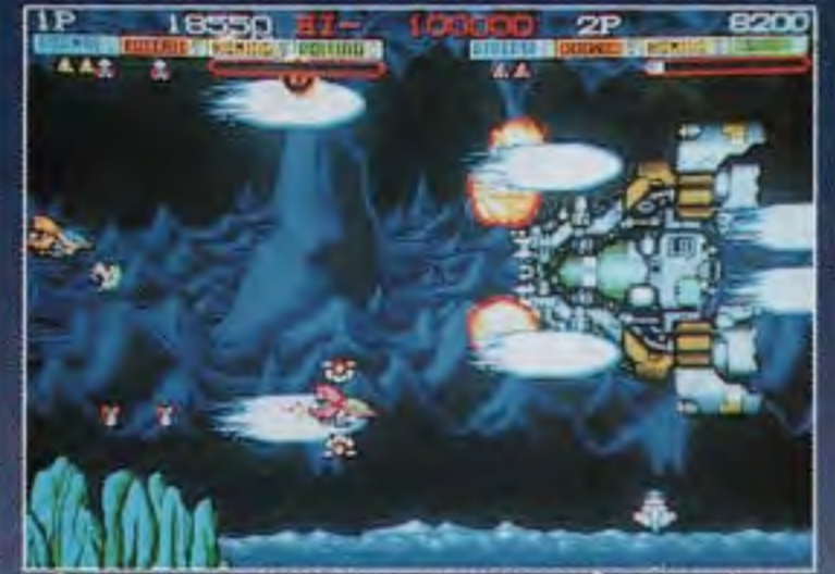
凄まじいスペシャルウェポンの威力