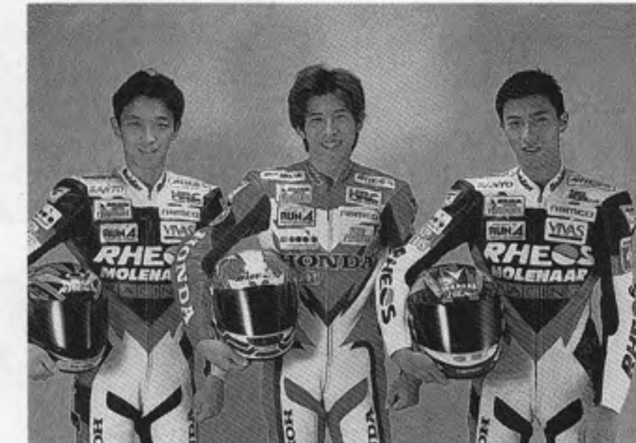
The "Three Aoki Brothers"

On April 1, Namco signed a personal sponsorship agreement with the "Three Aoki Brothers" whereby they agreed to have the Namco logo on their racing uniforms when racing in the "GWP" all over the world.