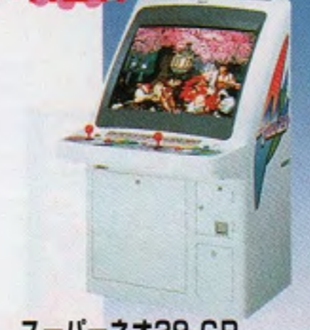
スーパーネオ29-CP (POPカードタイプ)