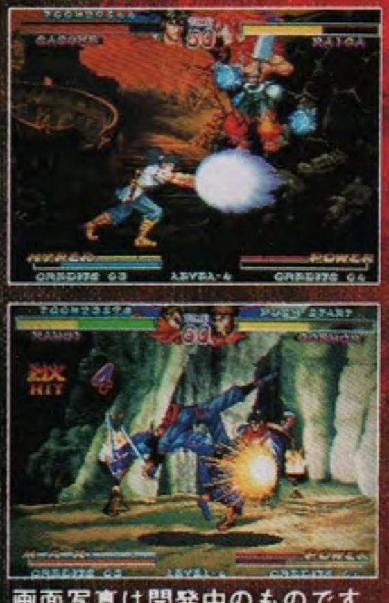
画面写真は開発中のものです。