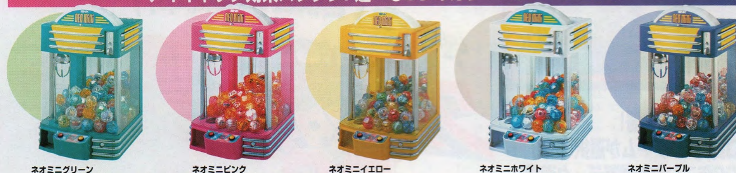
ネオミニグリーン