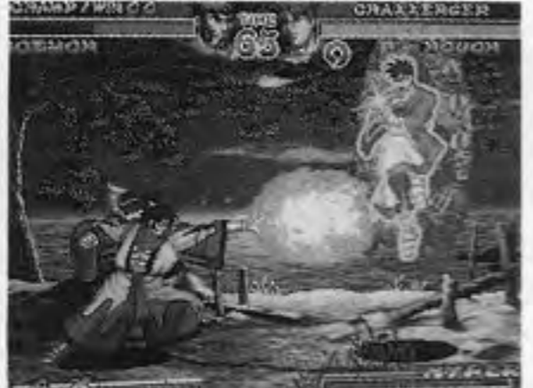
ニンジャマスターズ

大泥棒など計十人のキャラが対一で戦いを繰り返すという。各キャラが独特の技と武器を持つ状態とを任意に選べるのが特徴。