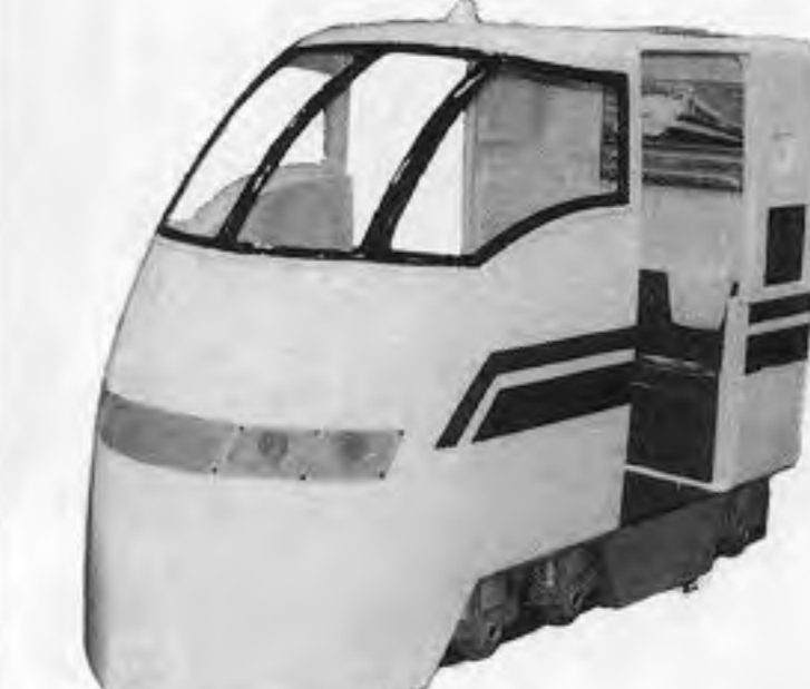
走れ！新幹線（下は内部）

で、数個がつかって落ちてくるのをレバーで移動、二つのボタンで回転させながら下部に横たわっていく。円玉が縦か横に