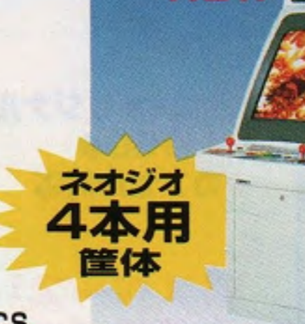
スーパーネオ29-OS (スタンプキータイプ)