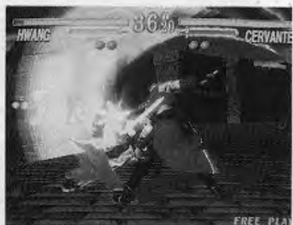
ソウルエッジ・バージョンII

（株）エトナ（本社大阪）が、中野哲雄社長が開発の落貨を高額硬貨に交換し、下物バスケットゲーム「もうちゃ」が、メデア商事という新しいコンセプトを採用したもので、両替バスケットと呼ばれる。落下物とは呼ばれ、円玉までの六種類の硬貨