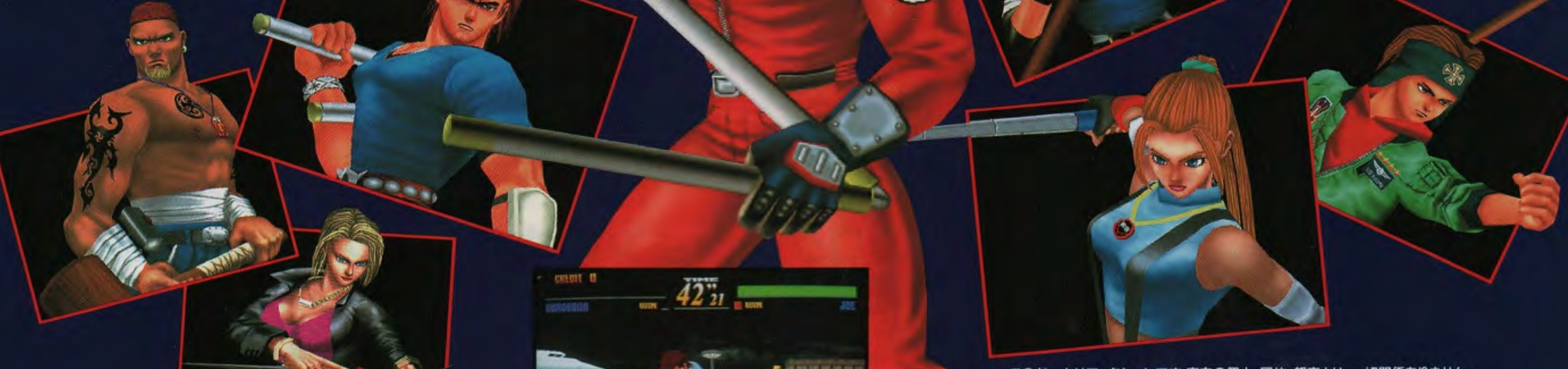
このゲームはフィクションです。実在の個人、団体、都市とは一切関係ありません。