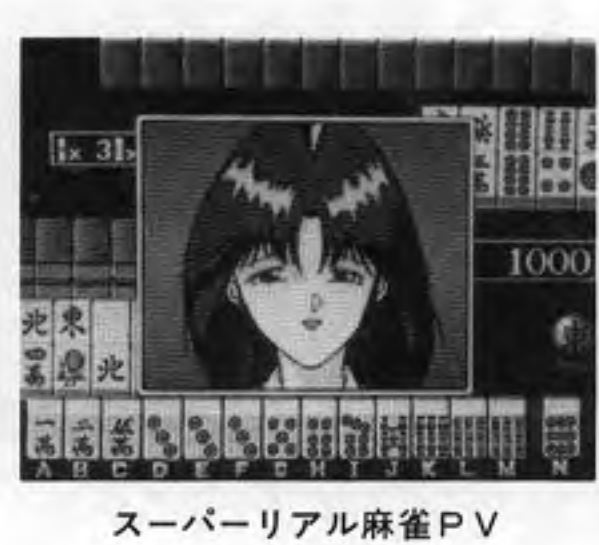
スーパーリアル麻雀PV

（本本社東京、中村雅哉社長）が、一定の正解数で次のシナリオに進むが、正解に要した時間とスコアによって異なる攻撃方法によって相手を倒す（アニメーションで表現）という格闘形式が盛り込まれているのが特徴。二人対戦や二人協力プレイも可能。カセット価格六万八千円。