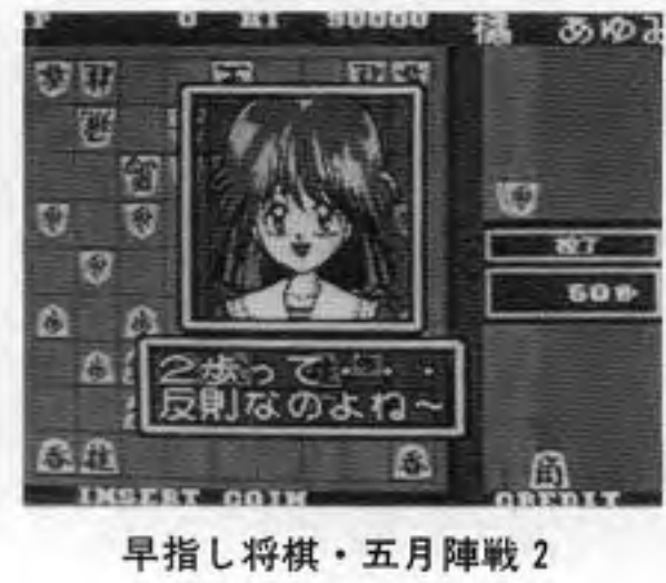
早指し将棋・五月陣戦2

（本本社東京、中村雅哉社長）が、一定の正解数で次のシナリオに進むが、正解に要した時間とスコアによって異なる攻撃方法によって相手を倒す（アニメーションで表現）という格闘形式が盛り込まれているのが特徴。二人対戦や二人協力プレイも可能。カセット価格六万八千円。