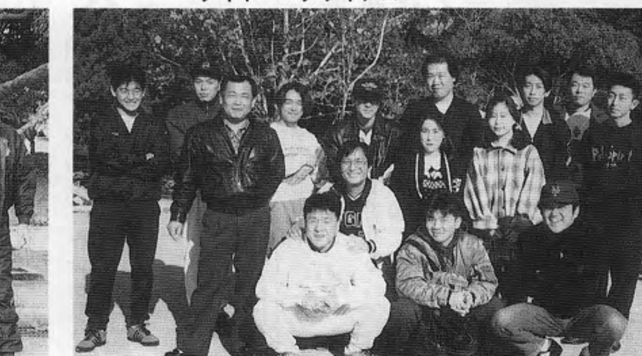
シグマ・カシワ・ウイナーズ