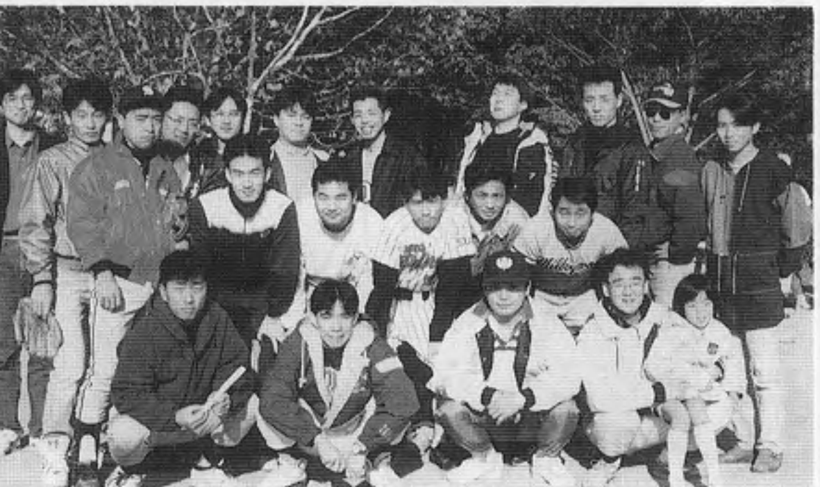
コナミ・ウッキーズ/カフェルコルト