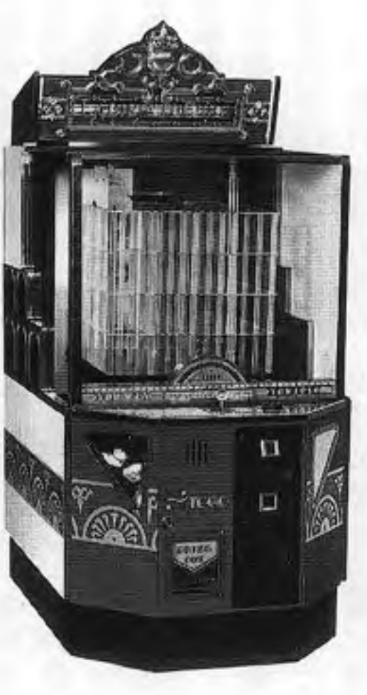
ラビリンズキューブ

立体迷路は、組替えてコースレイアウトを変更することもできる。OP価格七十七万六千円。