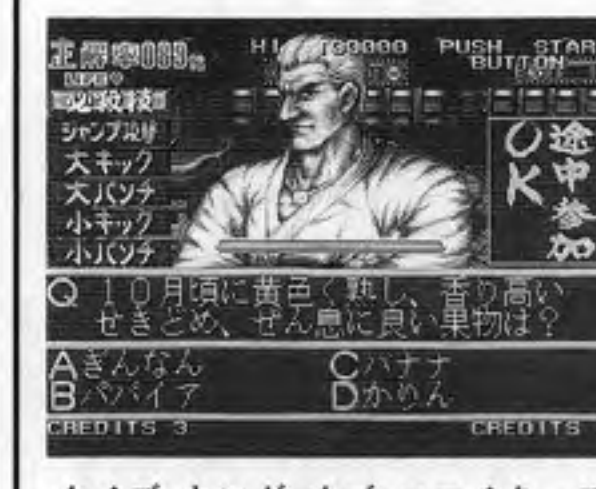
クイズ・キング・オブ・ファイターズ

ザウルス（本社東京、中村雅哉社長）が、一定の正解数で次のシナリオに進むが、正解に要した時間とスコアによって異なる攻撃方法によって相手を倒す（アニメーションで表現）という格闘形式が盛り込まれているのが特徴。二人対戦や二人協力プレイも可能。カセット価格六万八千円。