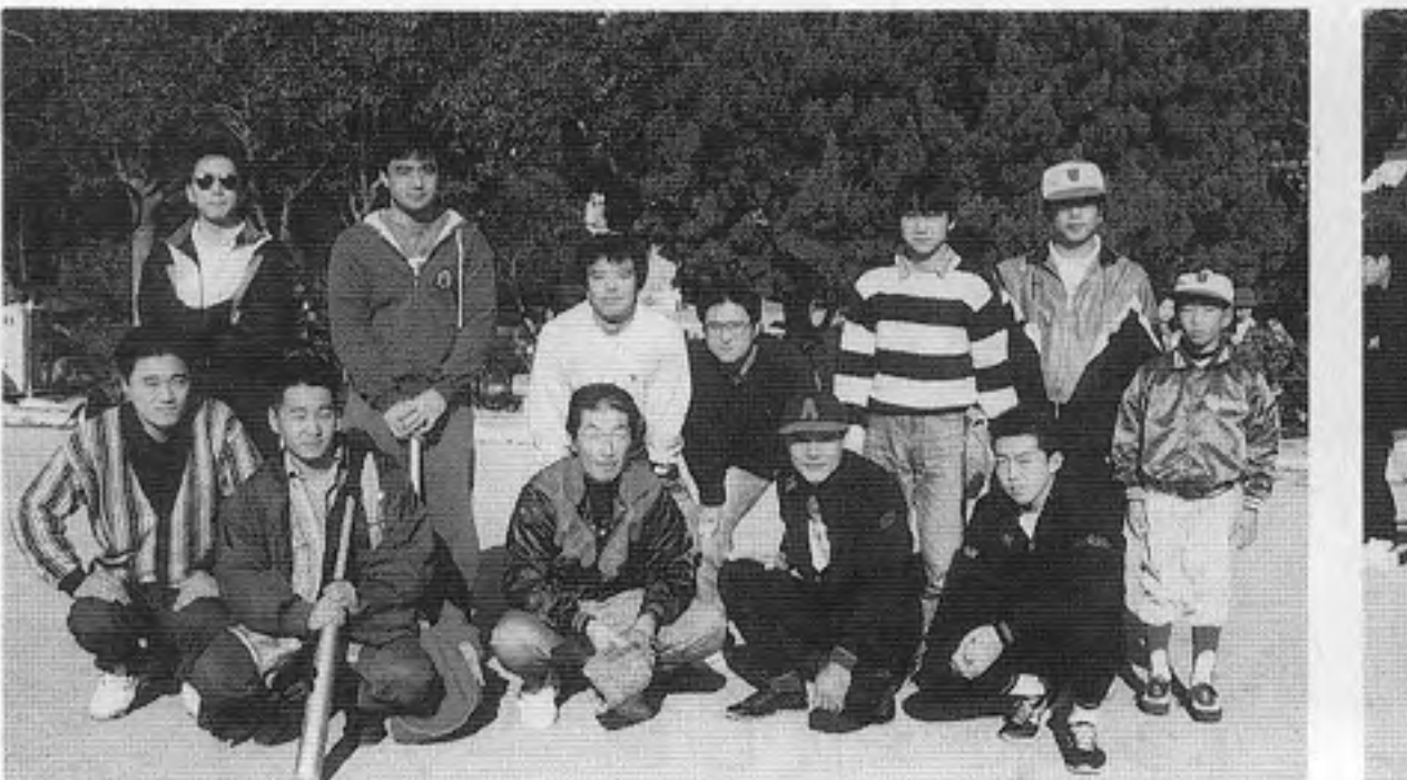
タイター・ドライアス