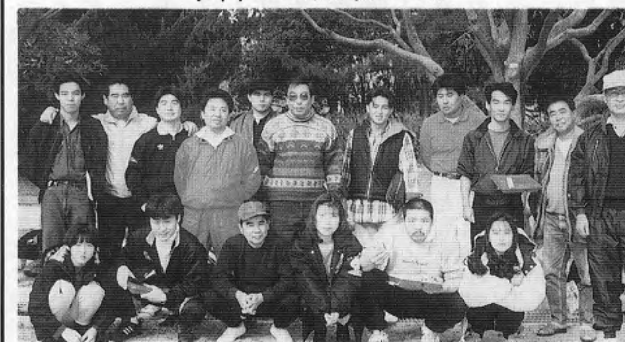
ユウビス・スパイクンタイク