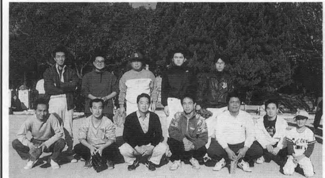
タイター・パルボンパズ