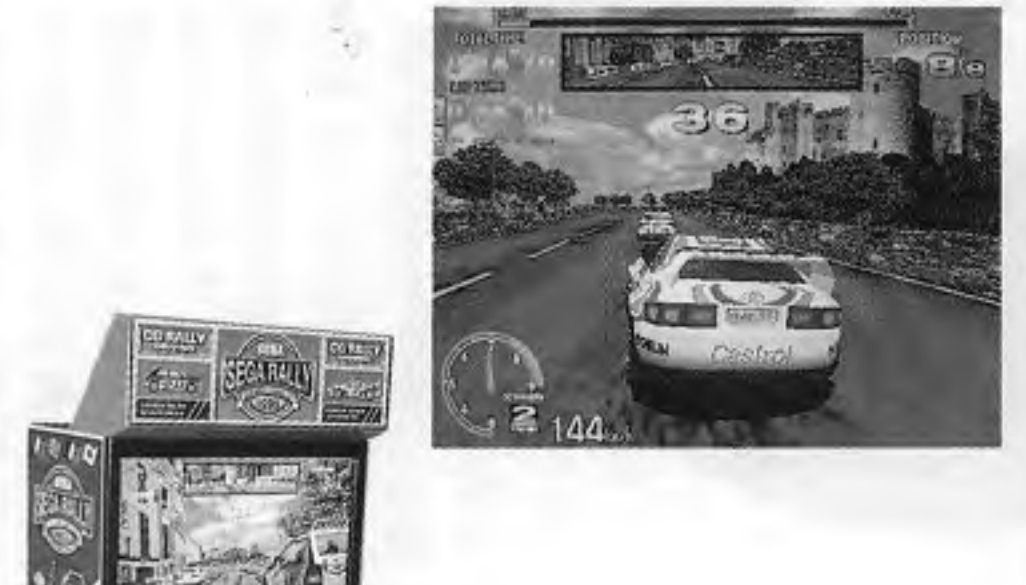
セガラリーチャンピオンシップ

（選択）を操作する。画面の視点は二段階（ドライブレゲーム機「セガラリーチャンピオンシップ」）に切替えることができる。トヨタとフィアット社の協力を得て採用した「ニル2」を使用したリアルな画像で、ハンドル、アクセル、ブレーキと四速ギア、それらのラリー仕様車を選択。またコースは初級から上級まで用意されている。