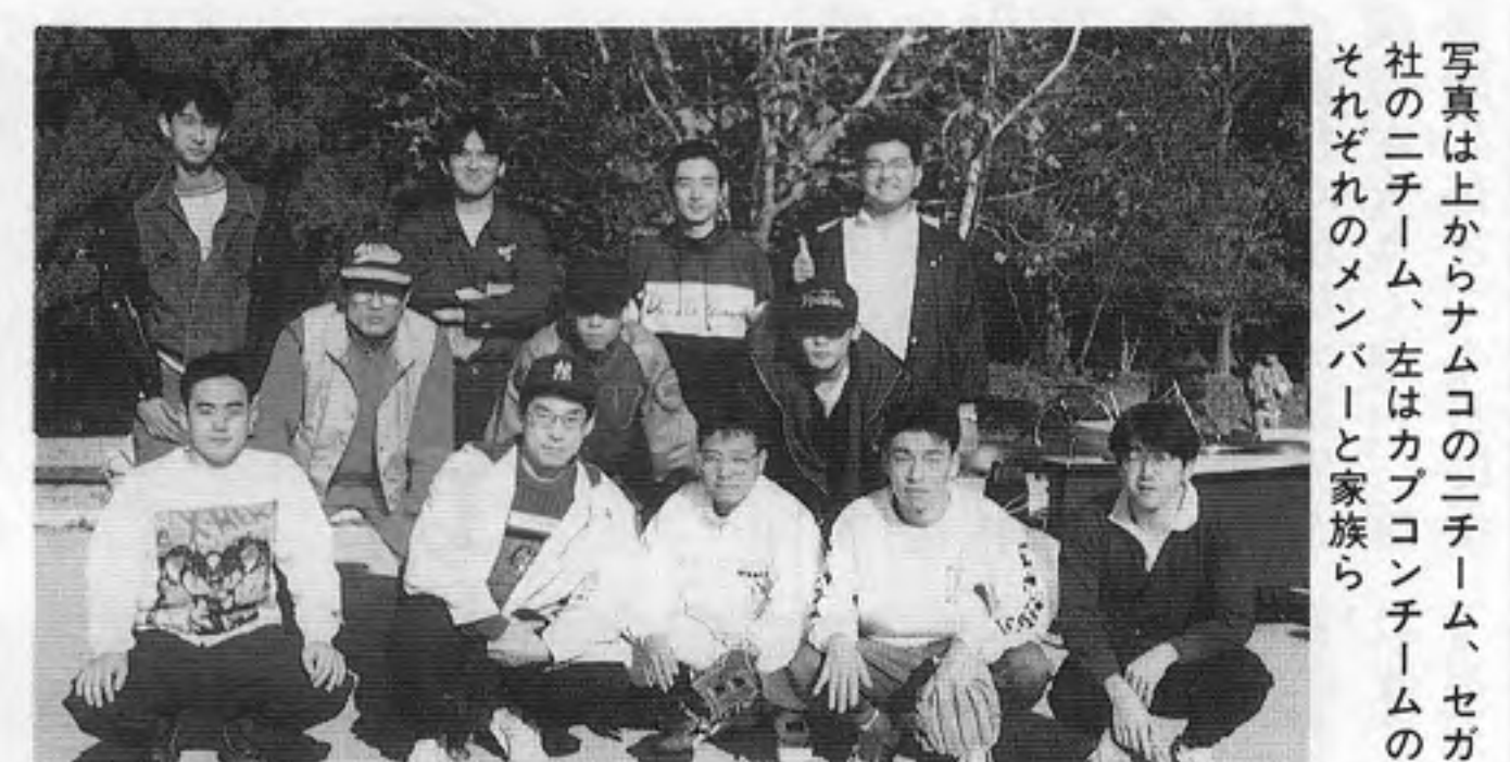
写真は上からナムコの二チーム、セガの二チーム、主はカブコンチームのそれぞれのメンバーと家族。