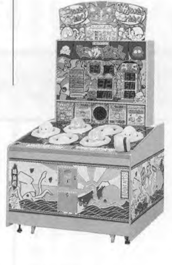
たこいかばにつく