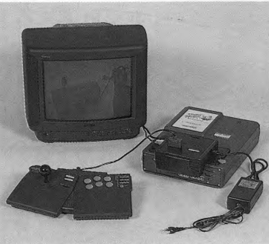
カプコン家庭用「CPSチェンジャー」

コンパイルが同社開発のTVゲーム「ぶよぶよ」のキャラクターを生かして、まんじゅう「ぶよぶよ」を十二月三日に売り出したところヒット商品になったという。地元広島の人気商品である「もみじまんじゅう」の製造元に委託開発したもので、「ぶよぶよ」キャラクターのまんじゅう十六個入り一箱千五百円で、JR駅売店などを通じて売られており、TVゲームから発展したキャラクター商品と言えよう。 「ぶよぶよ」は業務用のほか家庭用パソコンの選択眼は厳しいのであるが、ゲームの基