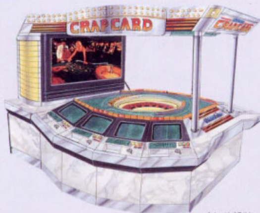
イメージイラスト