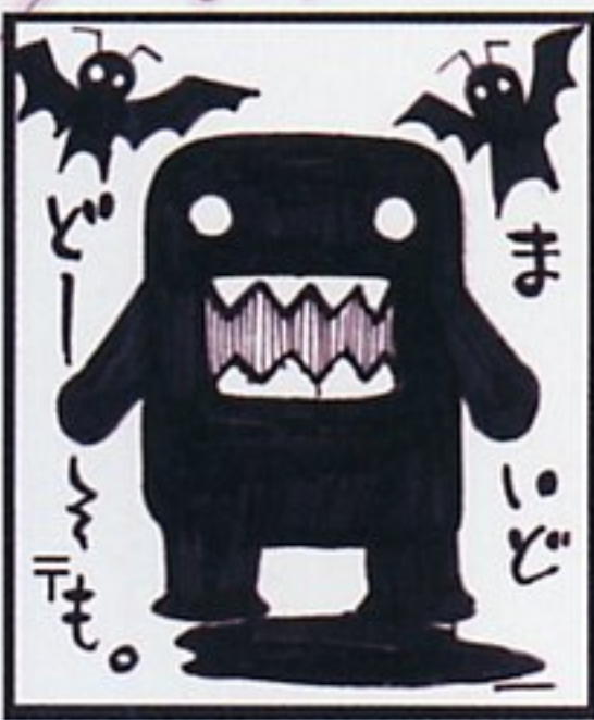
★カットとが集めてみました