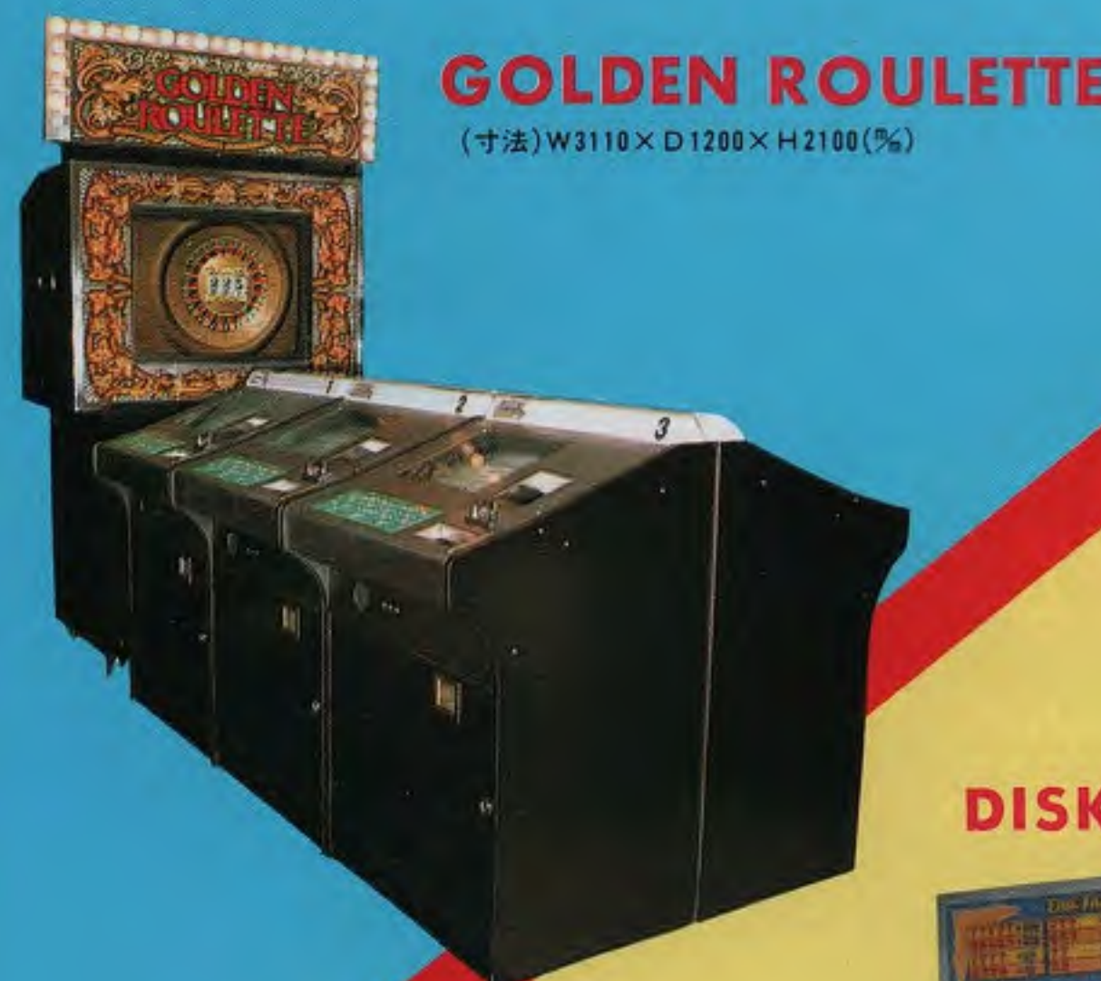
GOLDEN ROULETTE (寸法)W3110×D1200×H2100(%)