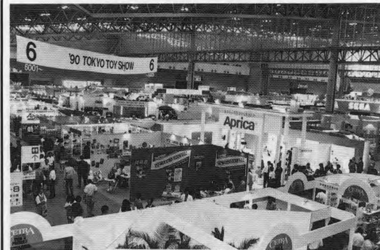
東京おもちゃショー90にて、上は会場の一部、下はセガ社の小間に