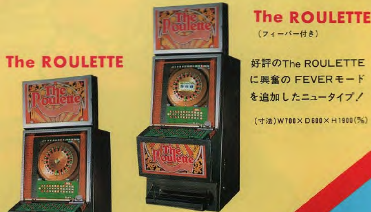
The ROULETTE (寸法)W700×D600×H1900(%) 好評のThe ROULETTEに興奮のFEVERモードを追加したニュータイプ!