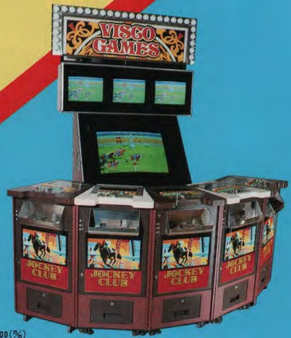
GOLDEN JOCKEY CLUB (寸法)W2000×D1200×H2100(%) 天候、馬場状態、馬のコンディションをリアルに表現!

メダルゲーム機の設置運営につきましては「メダルゲーム運営基準」を守ってご使用下さい。