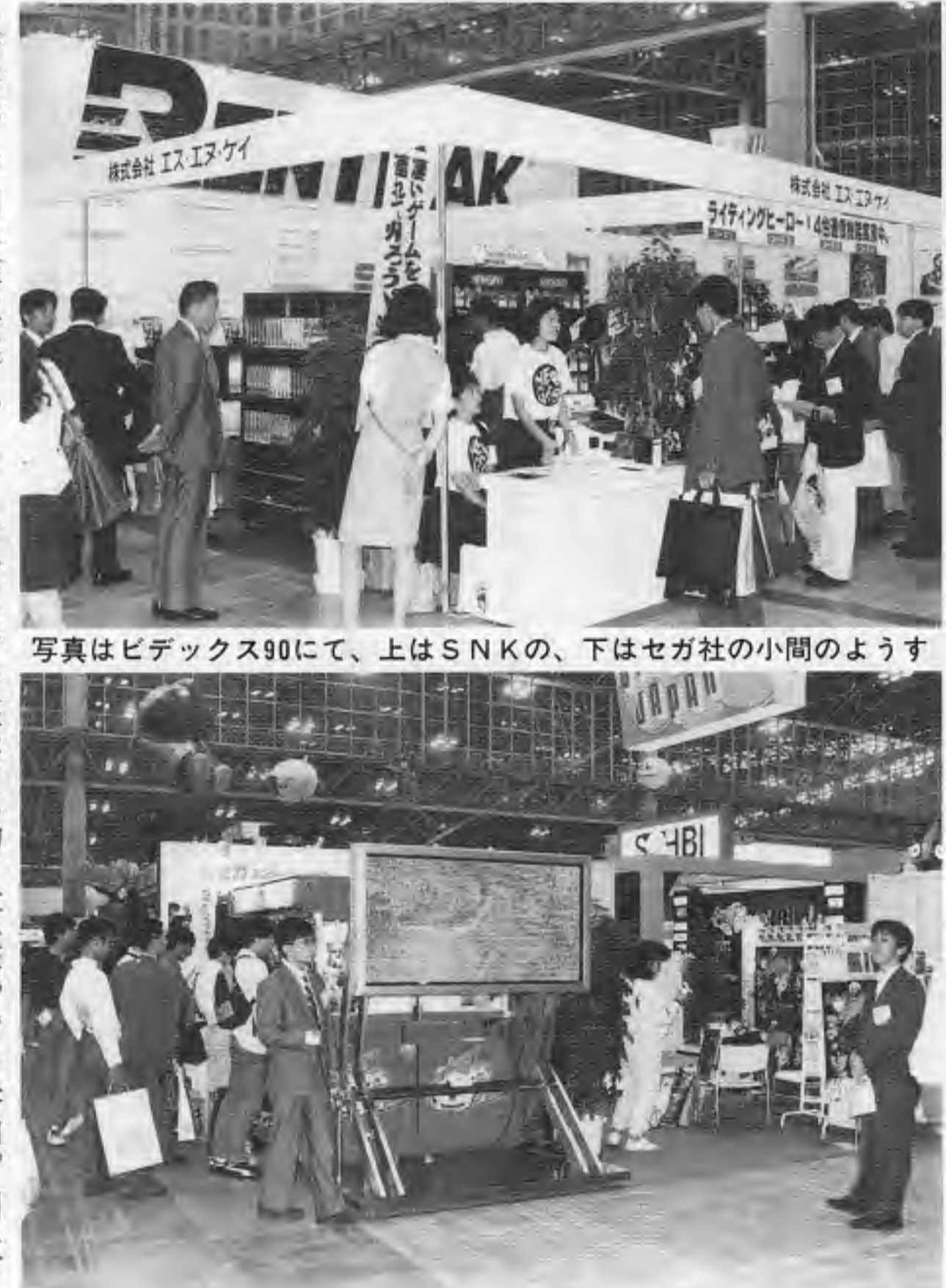
写真はビデオソフト90にて、上はSNKの、下はセガ社の小間のような