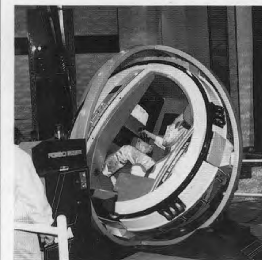
The prototype of Sega's "R-360"

The "R-360" allows the player to enjoy a dog fight as a jet fighter crew.