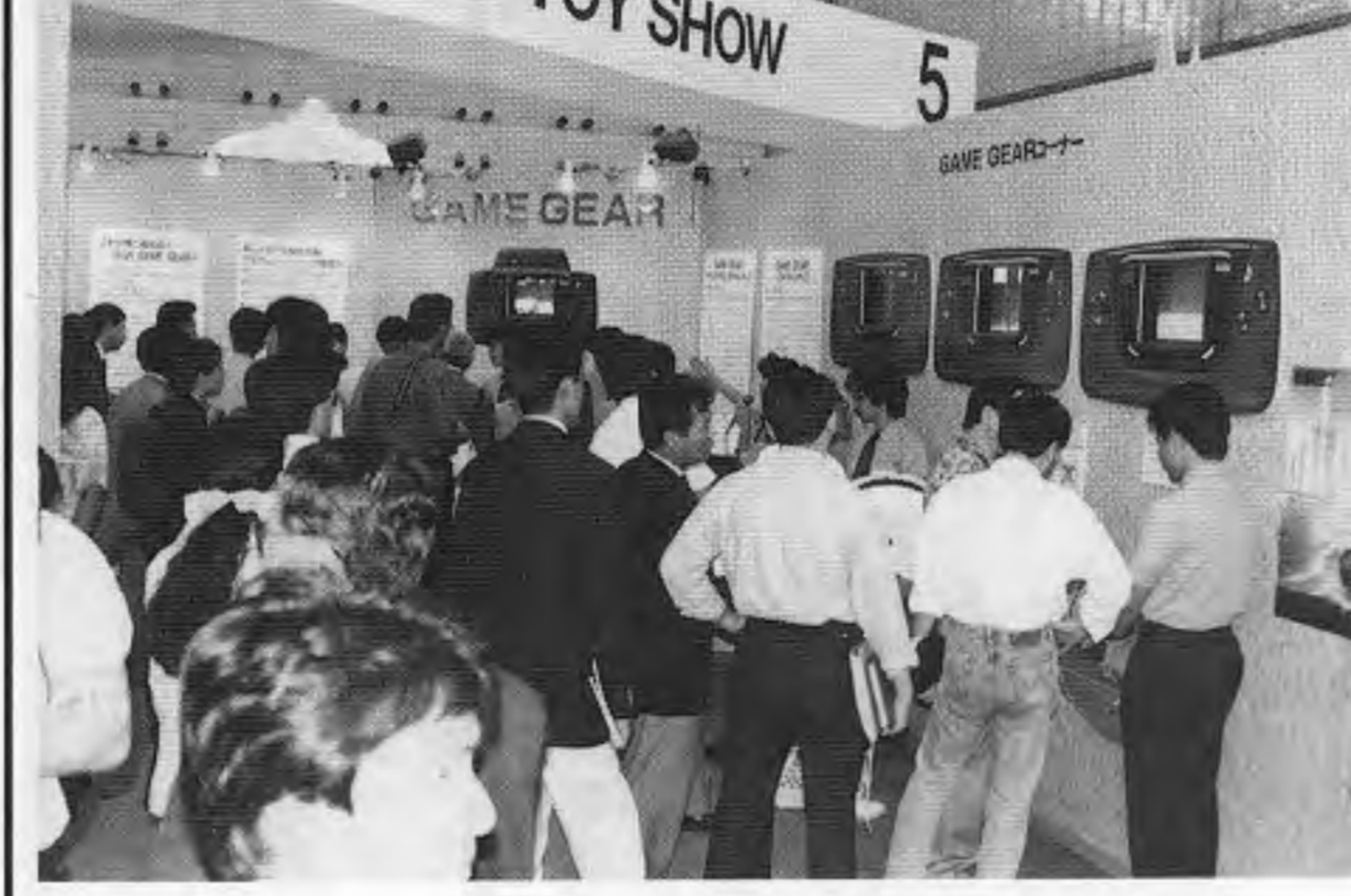
東京おもちゃショー90にて、上は会場の一部、下はセガ社の小間に