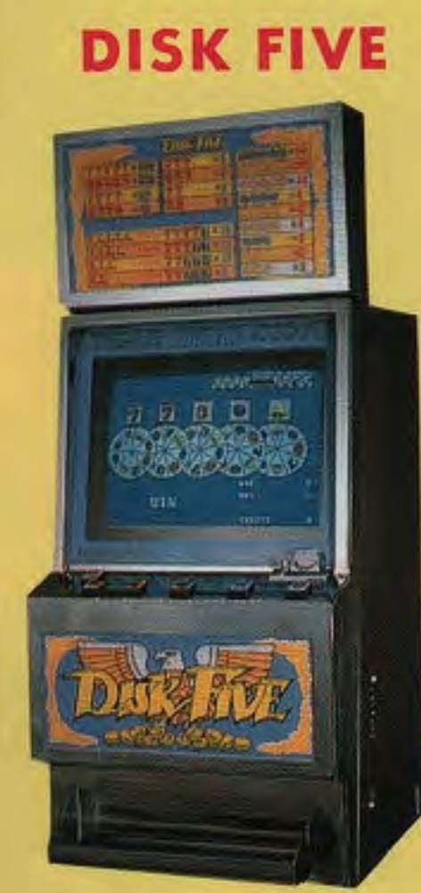
DISK FIVE (寸法)W800×D600×H1900(%) 数字を狙って矢を放つ宝くじ感覚のニューゲーム