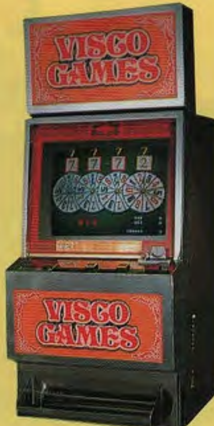
DISK FOUR (寸法)W700×D600×H1900(%) リアルなCGで本場カジノの醍醐味を再現!