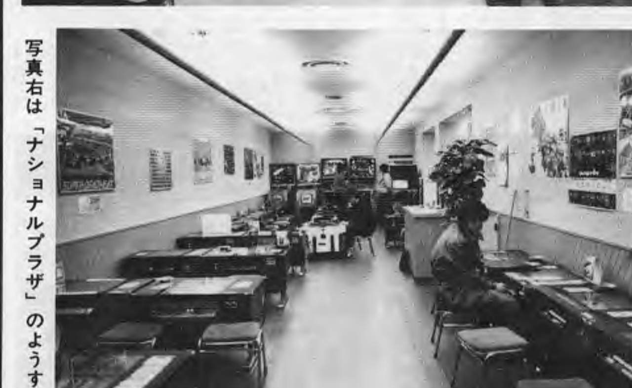
写真右は「ナショナルプラザ」の様子

「ニューオリンピア」はもう十五年近くも営業しているこの周辺では最も古いゲーム場。八号営業店として「(株)アミューズメント広島営業所」の名称で営業しているが、古くからの名前「ニューオリンピア」で親しまれている。運営者は(株)アミューズメント。フロア面積は約百三十二平方メートル。総機械台数は約八十五台。このうちメダルゲーム機が二十一台。料金は百円と五十円。営業時間は午前十一時から午後九時。平日は午後三時から営業になる。同日ではさまざまなサービスを行っているが、過当競争で客は減少しているようだ。