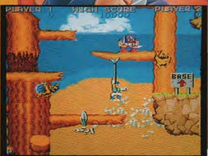
ワイヤーを引っかけて上へ登れ!

○ボタンとレバーを操作して、ワイヤーを張ったり 縮めたり、また空中を移動したりつかまえたりと いろんな遊びが楽しめます。