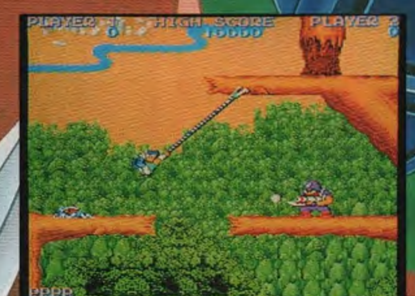
斜めに張って空中移動