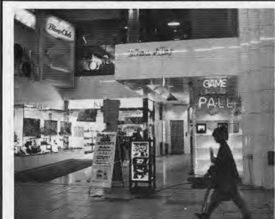
左は「プレイゾーン・パル」の外観、下は店内