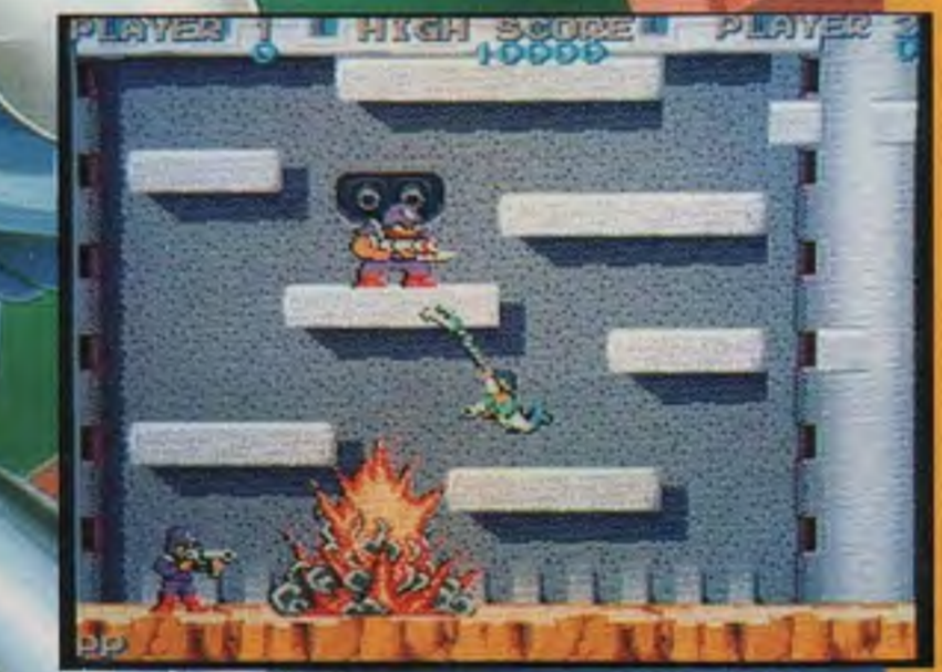
敵の見はりだ見つかるな!