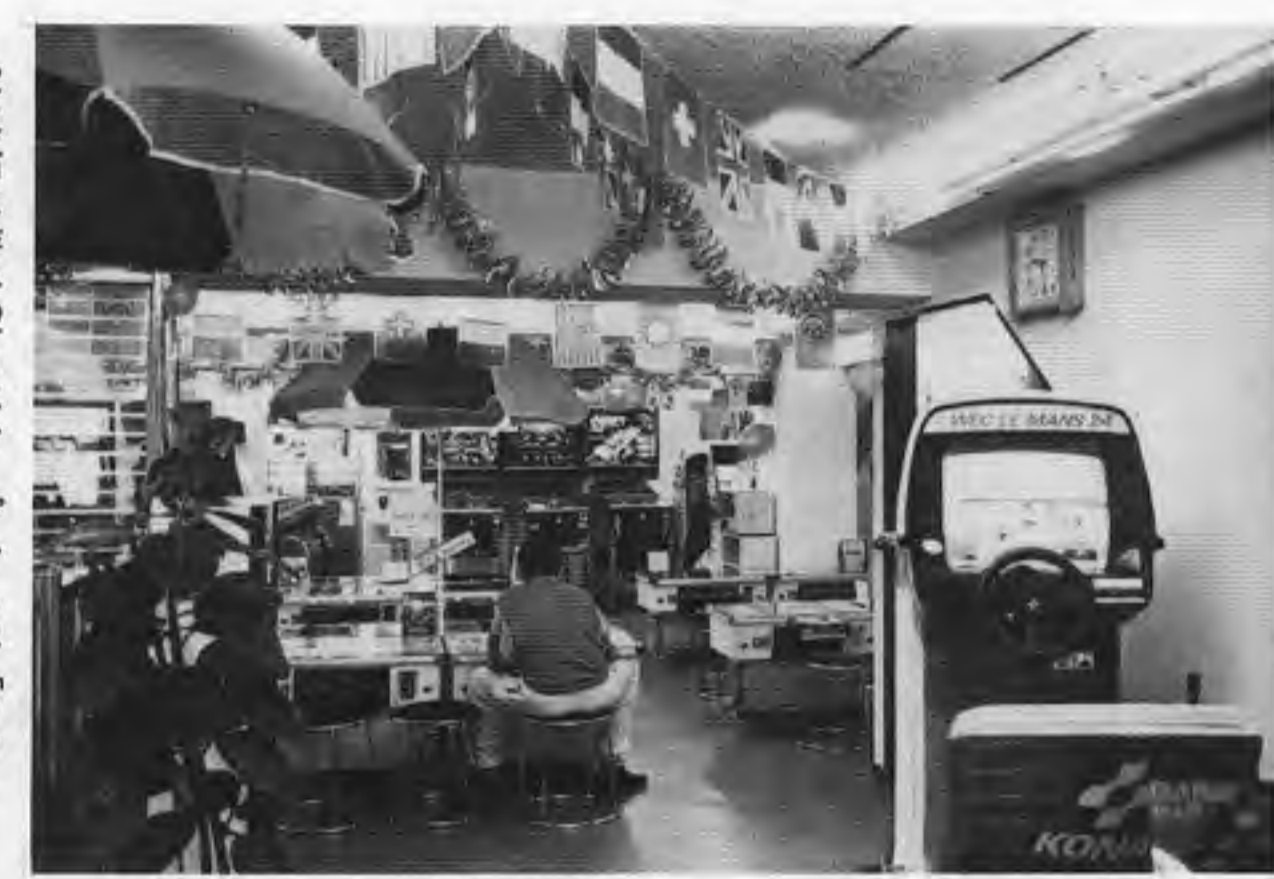
写真右は昨年12月にオープンした「リノ」

前回に引き続き「広島・流川」にスポットをあてる。今回紹介する流川町、堀川町、新天地、本通などの一帯は市内最大の繁華街で、屋上遊園地(三軒)を含めて十八軒ものロケーションが集中する。しかも、このうち九軒のゲーム場が新風営法施行後にオープンしている。これは興味深い。遊技機賭博がないことが、オペレーションを活発にしていると考えられるが、大目立ち、地元関係者の中には過当競争を感じている人が多い。