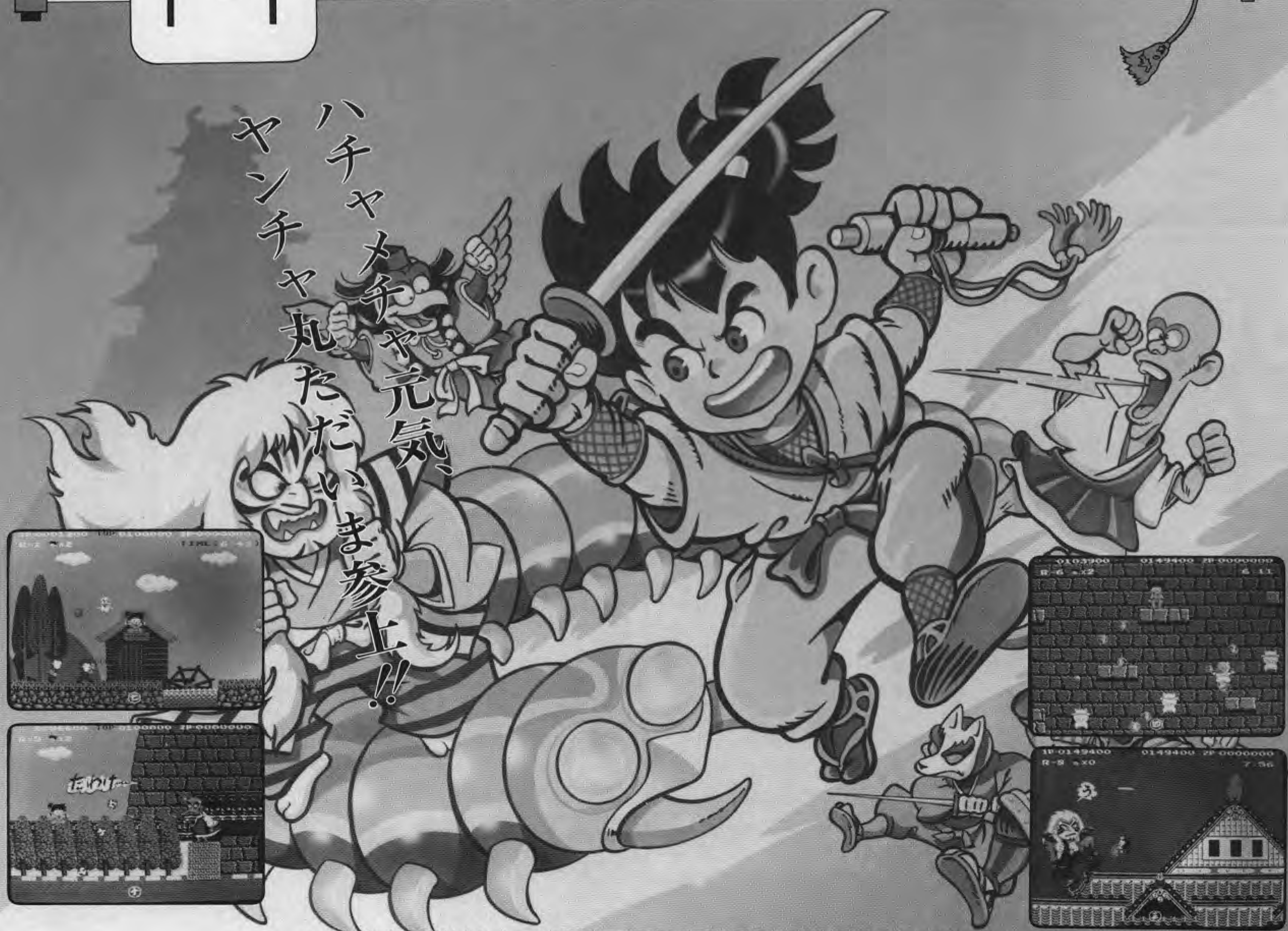
●この商品は弊社(アイレム販売)の応諾なしに海外への出荷はできません。

山、森、崖、洞窟、竹やぶ、寺、城壁、城内と舞台は盛りだくさん。そして道中には、おもわずのけぞるユニークなキャラクター達とその攻撃。とにかくリズミカルでハチャメチャに楽しいコミカル時代活劇ゲームの登場です。