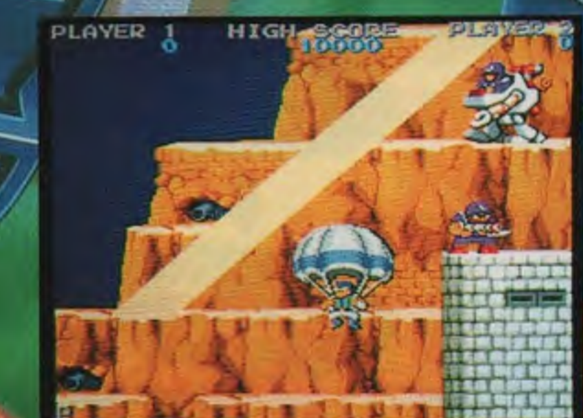
死んだプレイヤーはパラシュートで復活