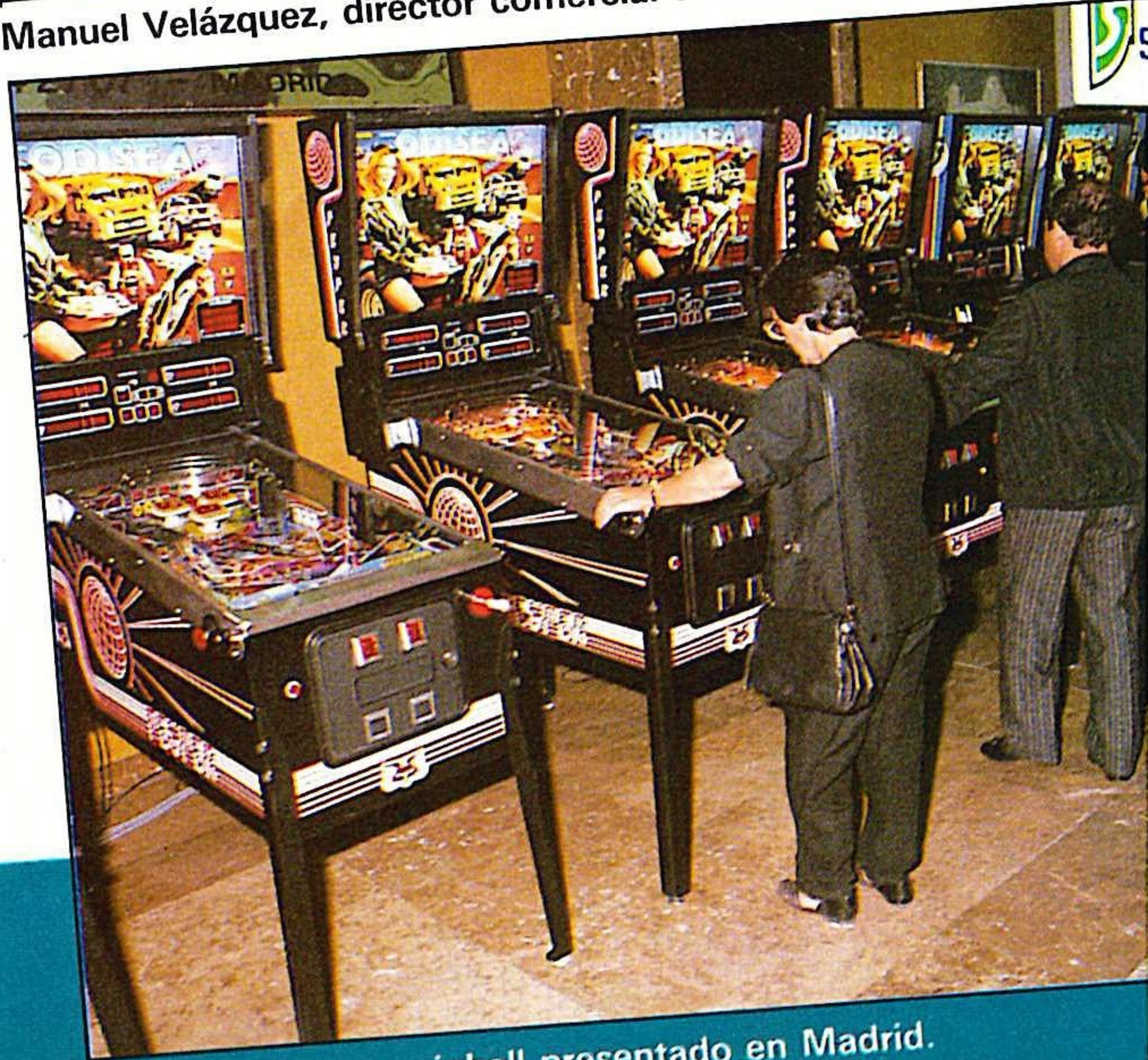
«Odisea» el nuevo pinball presentado en Madrid.