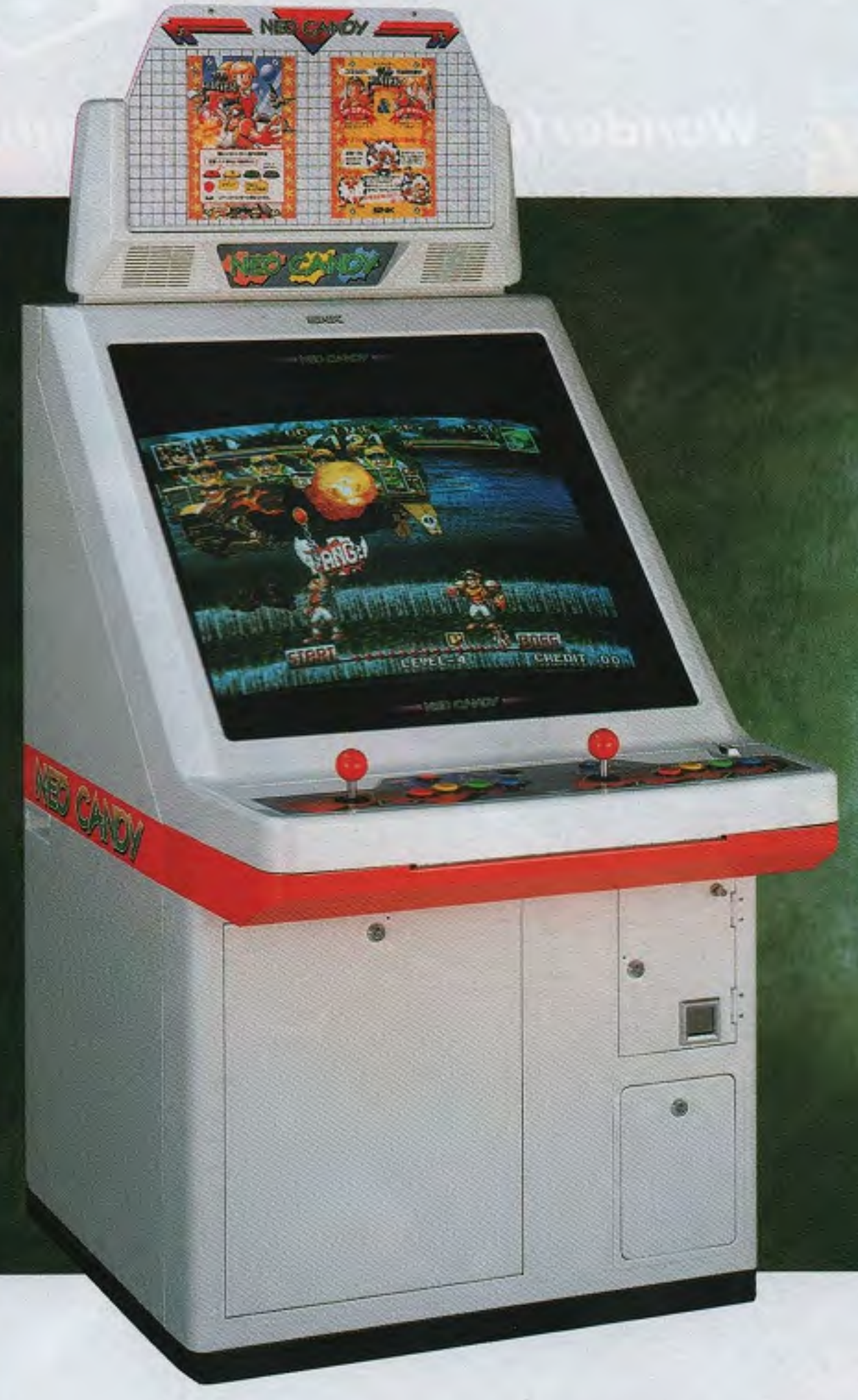
NEO CANDY29 JAMMA SPECIFICATIONS 29-INCH TYPE

●ブラウン管:29インチCRTカラーモニター ●電源電圧:AC100V±10V(50/60Hz) ●消費電力:120W ●重量:108kg ●外形寸法:幅715×奥行958(コンパネ含む)×全高1,440mm