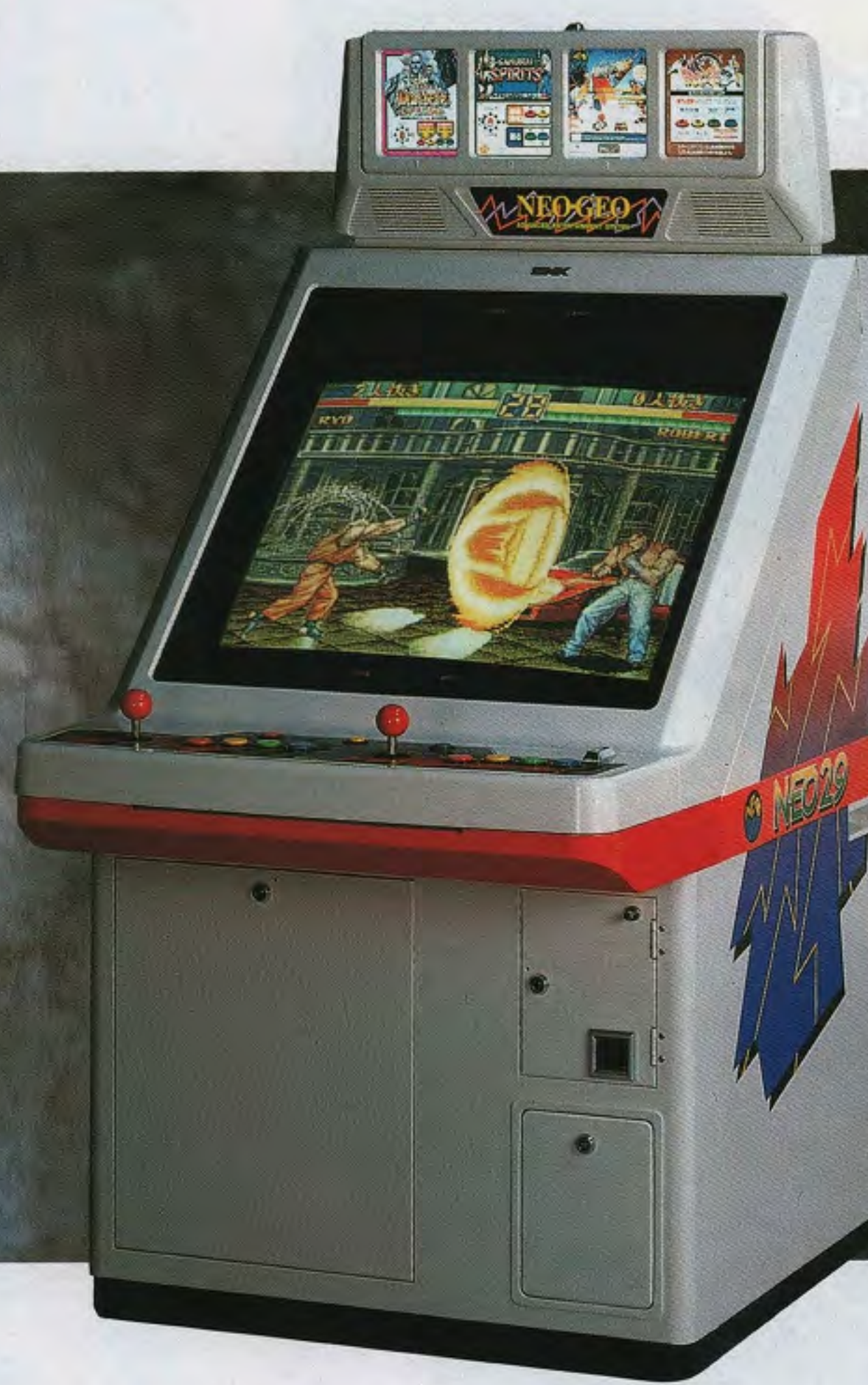
NEO29 MULTI VIDEO SYSTEM 4SLOT TYPE

●先進デザイン&ネオジオ仕様。 超人気のネオジオゲームと先進のデザインがロケーションを強化し高収益を実現。扱いやすく、耐久力・安定性をさらに抜群のネオジオ専用4本用筐体です。