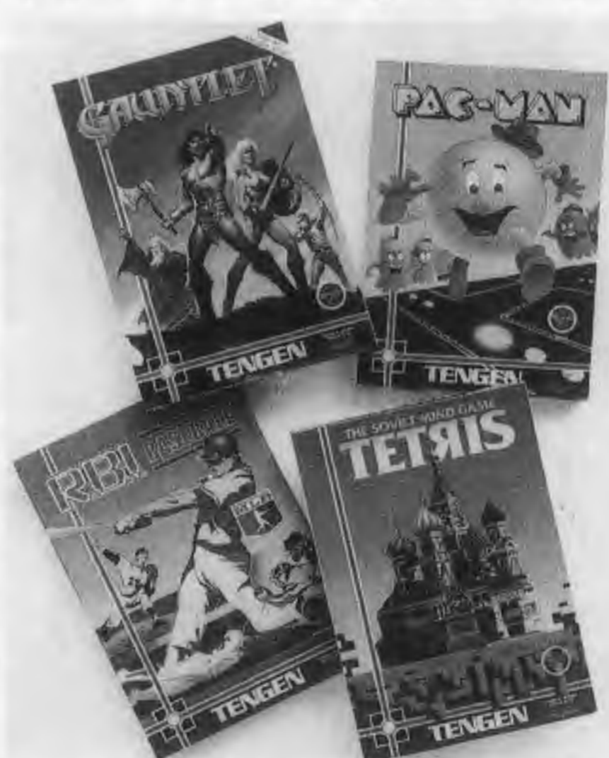
テンゲン社が独自生産に踏み切ったNES用4ゲーム(同社の広告から。「テトリス」は未発売)

の供給は、任天堂による自社ソフトのほか、任天堂以外のいわゆる「サードパーティ」が任天堂によるOEMを通じてそれぞれ販売してきている。ところがNES市場が急速に拡大、八八年末には一千万台(日本では一千二百五十万台)、八九年末には一千七百万台に達する勢いまでブーム化している反面、一年以上も続いているマスクROMなどの半導体不足のためほとんど需要を満たしていかないという状態が続いてきた。これは任天堂が八八年の目標三千万個に対し五千個と増産して