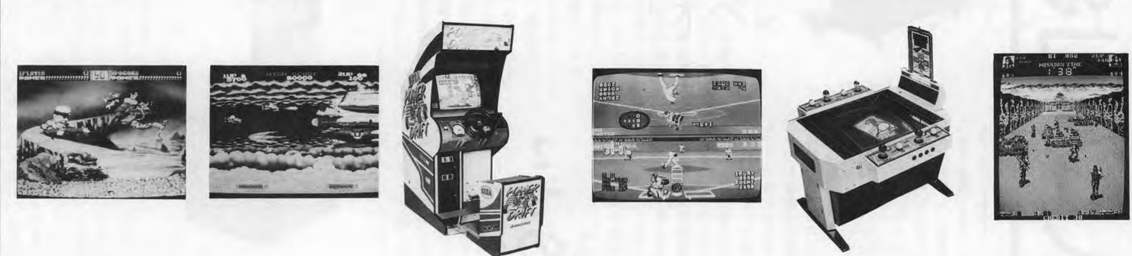
Gyojin, O-dayn, Power Lift, Eki Site Ryo, Bashing Shoot, Kuretsu. 各ゲームの紹介と価格情報。