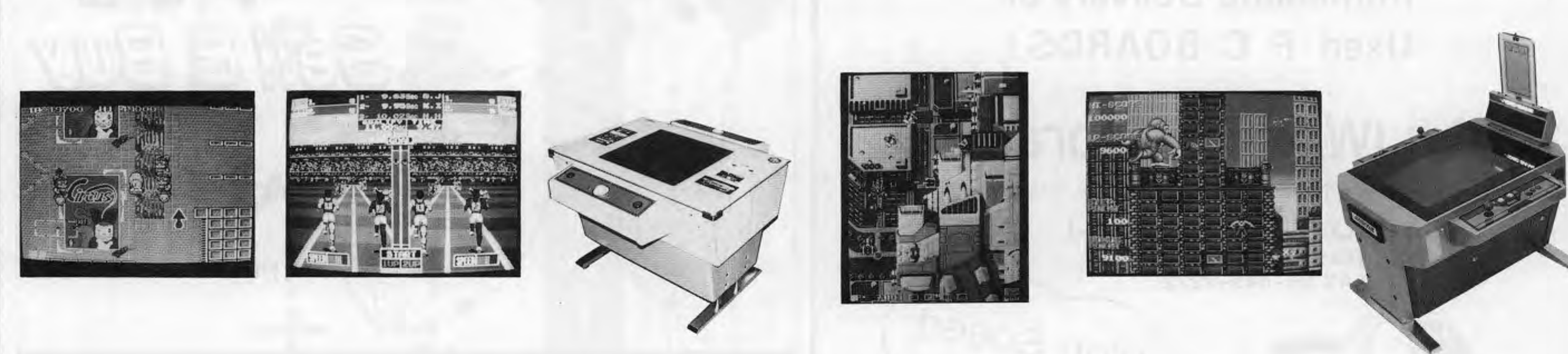
New Zealand Story, Goufosa Gold, Saiharon, Image Fight, Kreizier Climaxer 2, Skranplus Spirit (Arcade Type). 各ゲームの紹介と価格情報。