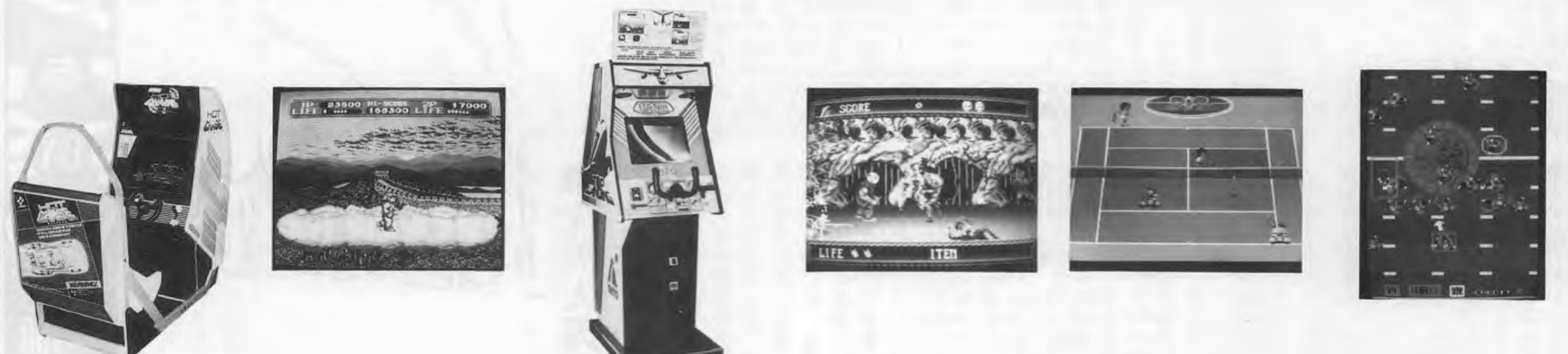
Hotchais, Break, Toppranting, Splatter House, World Court, Touchdown Fieber II. 各ゲームの紹介と価格情報。