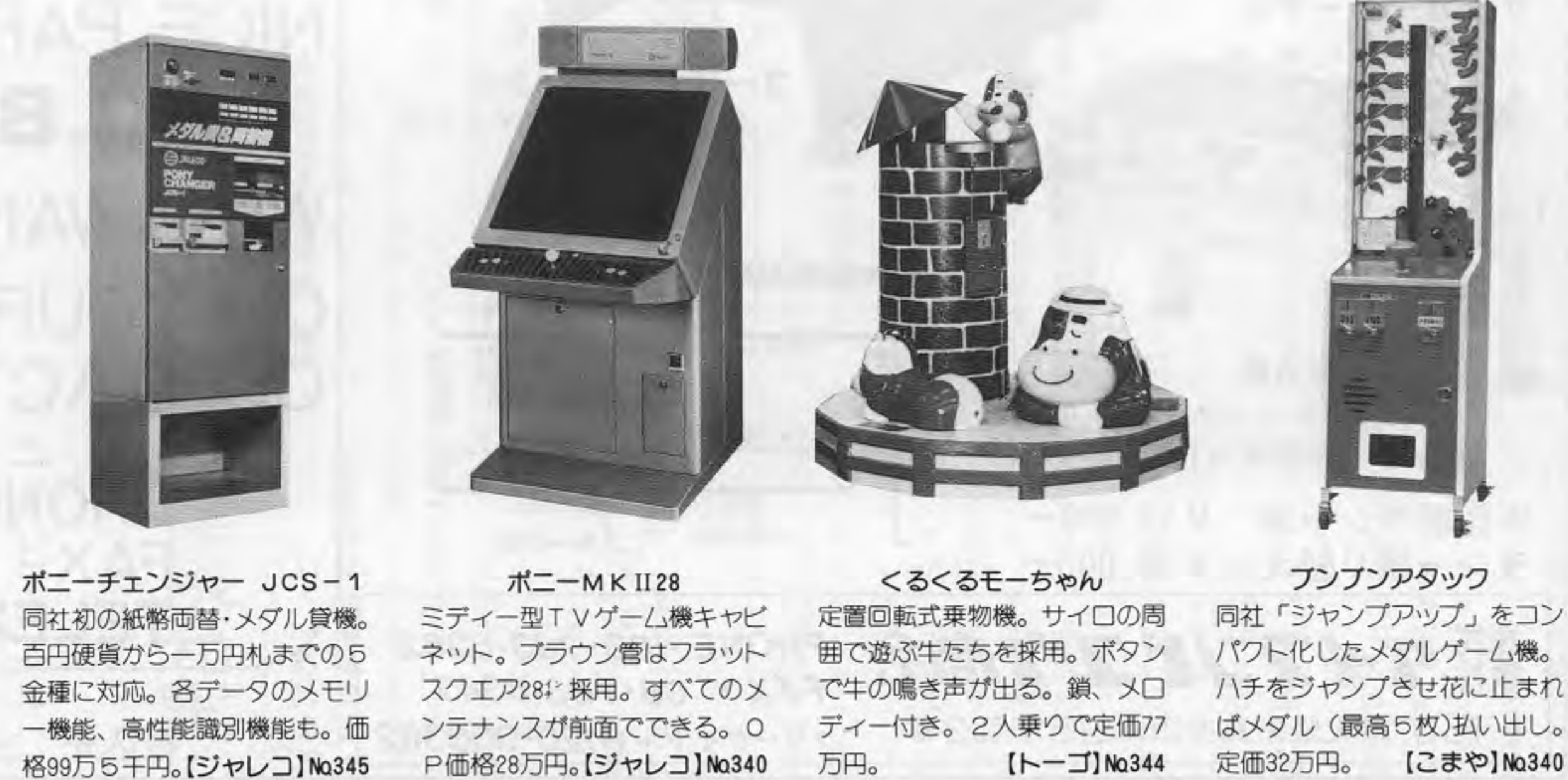
Poni-Chen JCS-1, Poni-MK II 28, Kurukuru Mochi-chan, Pumpnattak. 各ゲームの紹介と価格情報。

総目録索引 No.50 第323号(63年1月1日)掲載 No.51 第327号(63年3月1日)掲載 No.52 第332号(63年5月15日)掲載 No.53 第336号(63年7月15日)掲載 No.54 第341号(63年10月1日)掲載