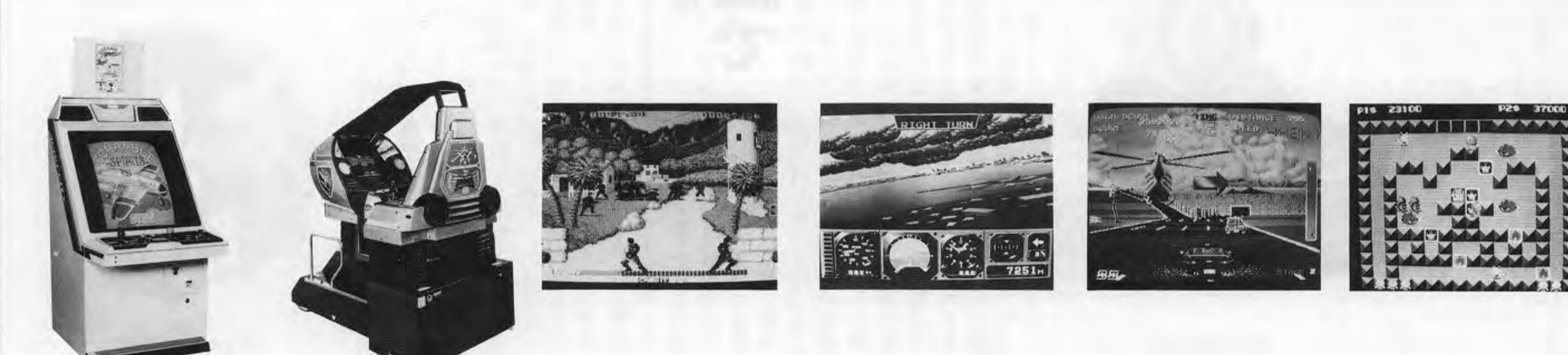
Skranplus Spirit, Metal Hawk, Kabeer, Toppranting, Cheis H.Q., Nyan Nyan Bunnik. 各ゲームの紹介と価格情報。