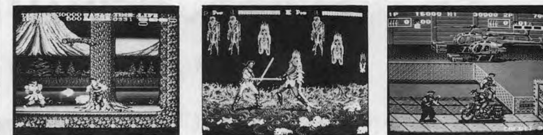
Iwano, Dance Z, Shokko. 各ゲームの紹介と価格情報。

本紙「話題のマシン」でとりあげた総目録です。とりあげた時点で④明らかなコピー機や⑤とばくに使用されやすいメダルゲーム機は、すでに排除しています。配列は①TVゲーム機、②アーケードゲーム機(プライズマシンを含む)、③メダルゲーム機、④乗物機、⑤その他に分類、それぞれ掲載順としました。社名のうしろの番号は掲載号数です。なお基板、ROMキットのみなどのTVゲーム機については画面の写真だけにしました。