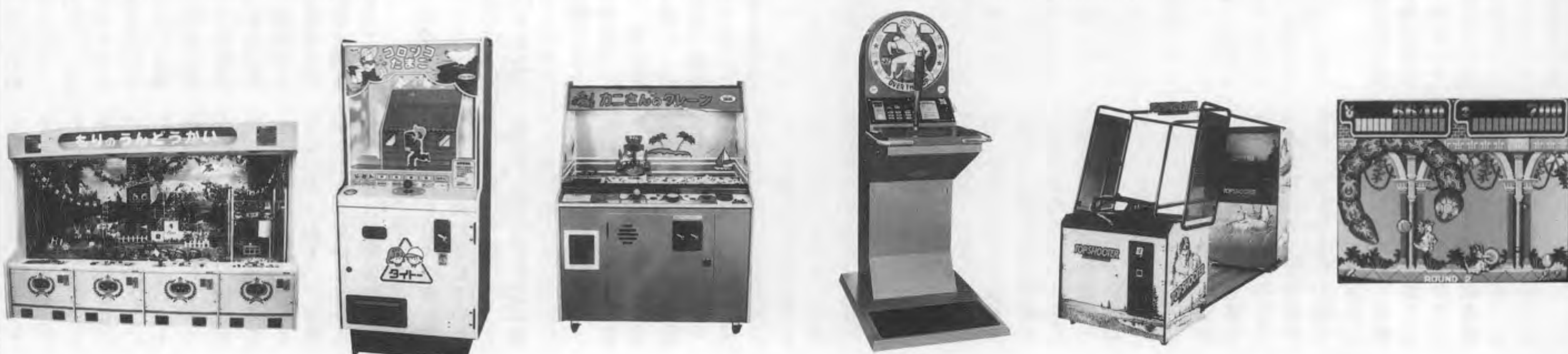
Mori no Udon-kai, Koronko Tamago, Kani-san no Clean, Over the Top, Top Shooter II, Monster Racer. 各ゲームの紹介と価格情報。

総目録索引 No.50 第323号(63年1月1日)掲載 No.51 第327号(63年3月1日)掲載 No.52 第332号(63年5月15日)掲載 No.53 第336号(63年7月15日)掲載 No.54 第341号(63年10月1日)掲載