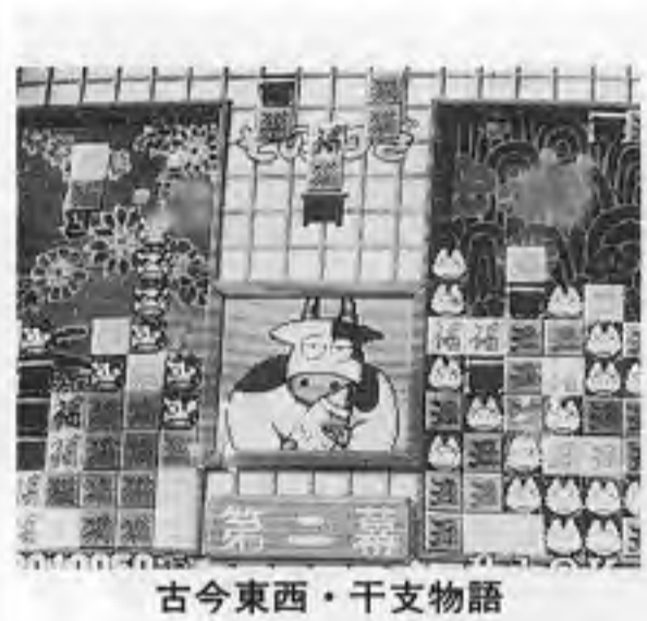
古今東西・干支物語