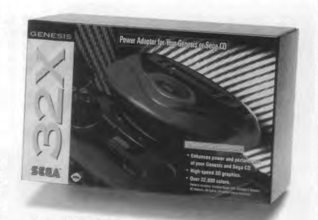
Contains all Genesis 32X system components: Genesis, Sega CD, control pad and software sold separately.

「マルチメディア」を旗印にする3DO社は、当初の勢いを失いつつあり、家庭用TVゲーム市場を拡大させた任天堂は、64ビット機計画を一度進めた。セガ社、ソニーの32ビット次世代機はまだ姿を現わさないという。今年夏の夏季CES94は、六月二十五日、シカゴ市内の McCormick & Co. Convention Center に開催され、うちマコーミックブリー