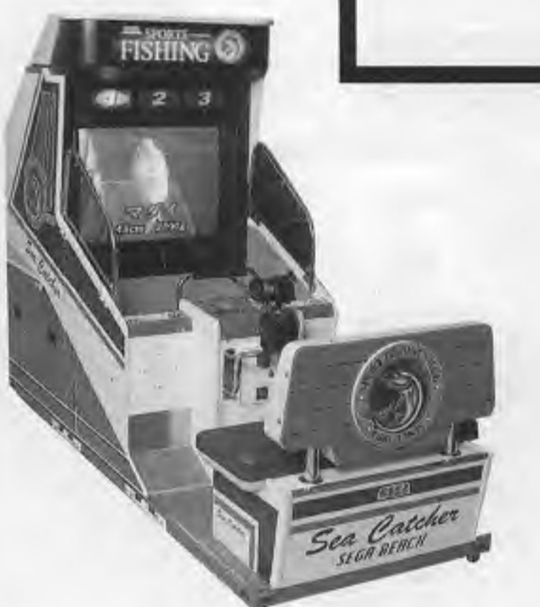
スポーツフィッシング