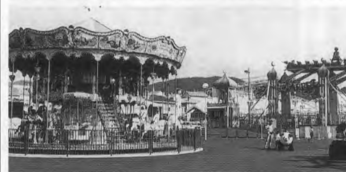
写真は上ととも「プレイランド」にて。上は高さ50メートルの観覧車「ジャイアントホイール」など。下は「ミニコースター」、2層式「メリーゴーランド」や「フライングカーペット」