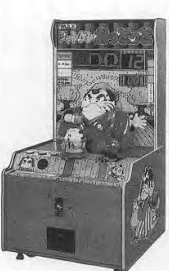
ジャンケンおとっと