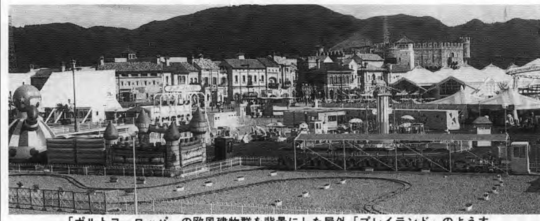
「ポルトヨーロッパ」の欧風建物群を背景にした屋外「プレイランド」の様子