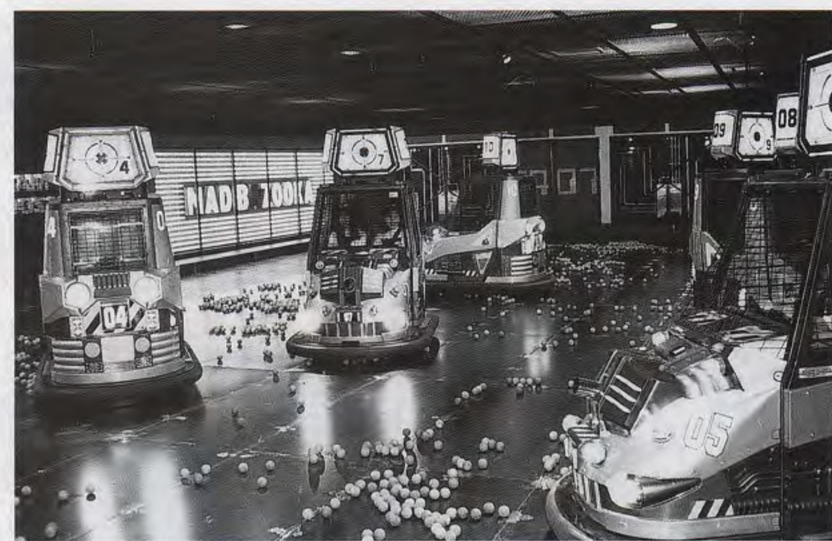
「マッドバズーカ」にて、バズーカ砲付きダッジエムカーに2人が乗り、運転しながらレバで砲身を上下させ他車の上部の的を狙いボタンでボールを発射。ボールは床から自動回収

する怪物(造形)を狙撃したり、停止して二百メートルと同時進行は金網で囲んで攻撃する場面があるほか、バック走行するコースもあり変化に富む。コース全長は約二百五十メートル、最大傾斜角度は三十度、最大時速二十五キロ、所要時間三分。六台まで順次送り出し運転。利用料金は六百円。 「マッドバズーカ」はバズーカ砲で攻撃し合うダッジエムカー。最大五台ずつ二チームに分かれ、ハンドルとアクセルと油门にバズーカ砲の操縦桿(上下動させ発射ボタンを押す)を操作。弾丸は塩化ビニール製ボールで床に転がっているボールを自動的に取り込み、バズーカ砲に送り込むというシステム。相手チームに総合順位や命中数などのデータが手渡される。二バル機十二種類を並べた「カーニバルストリート」