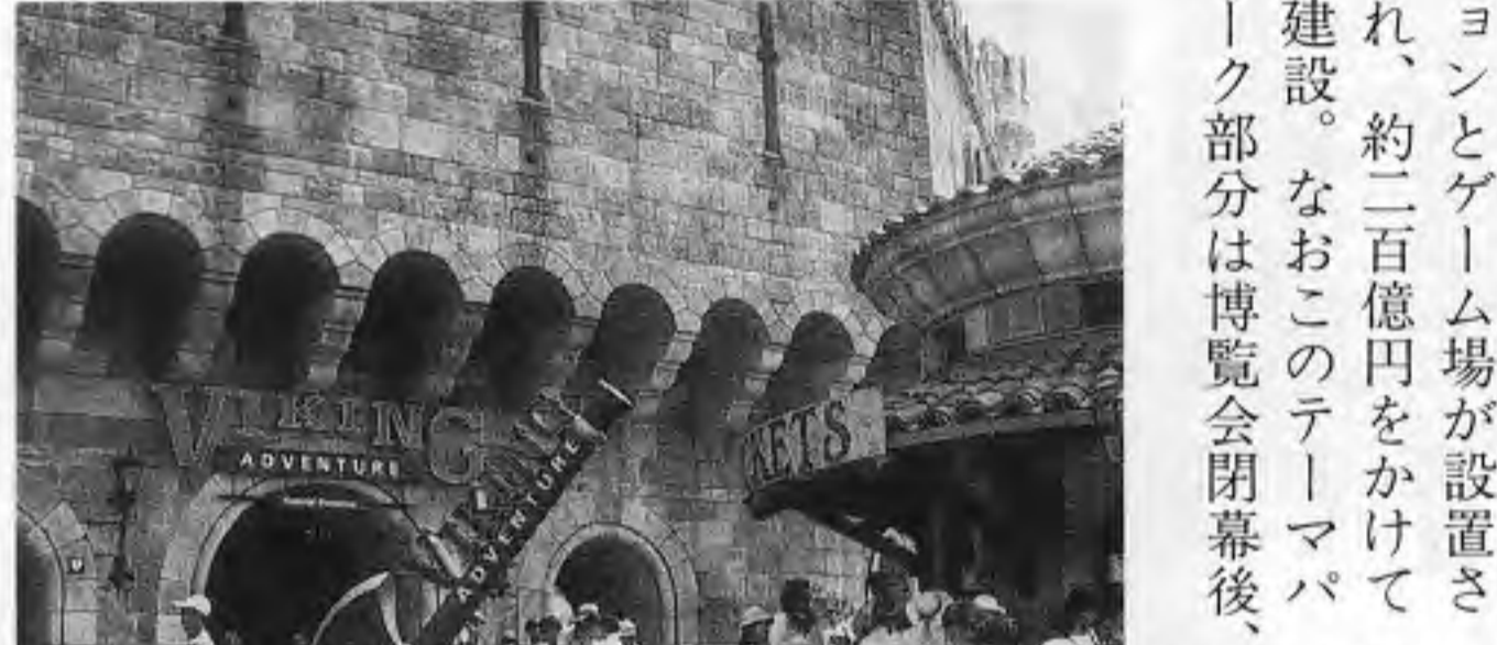
「バイキングアドベンチャー」の入口部分(左)と内部でのスタントショーの様子