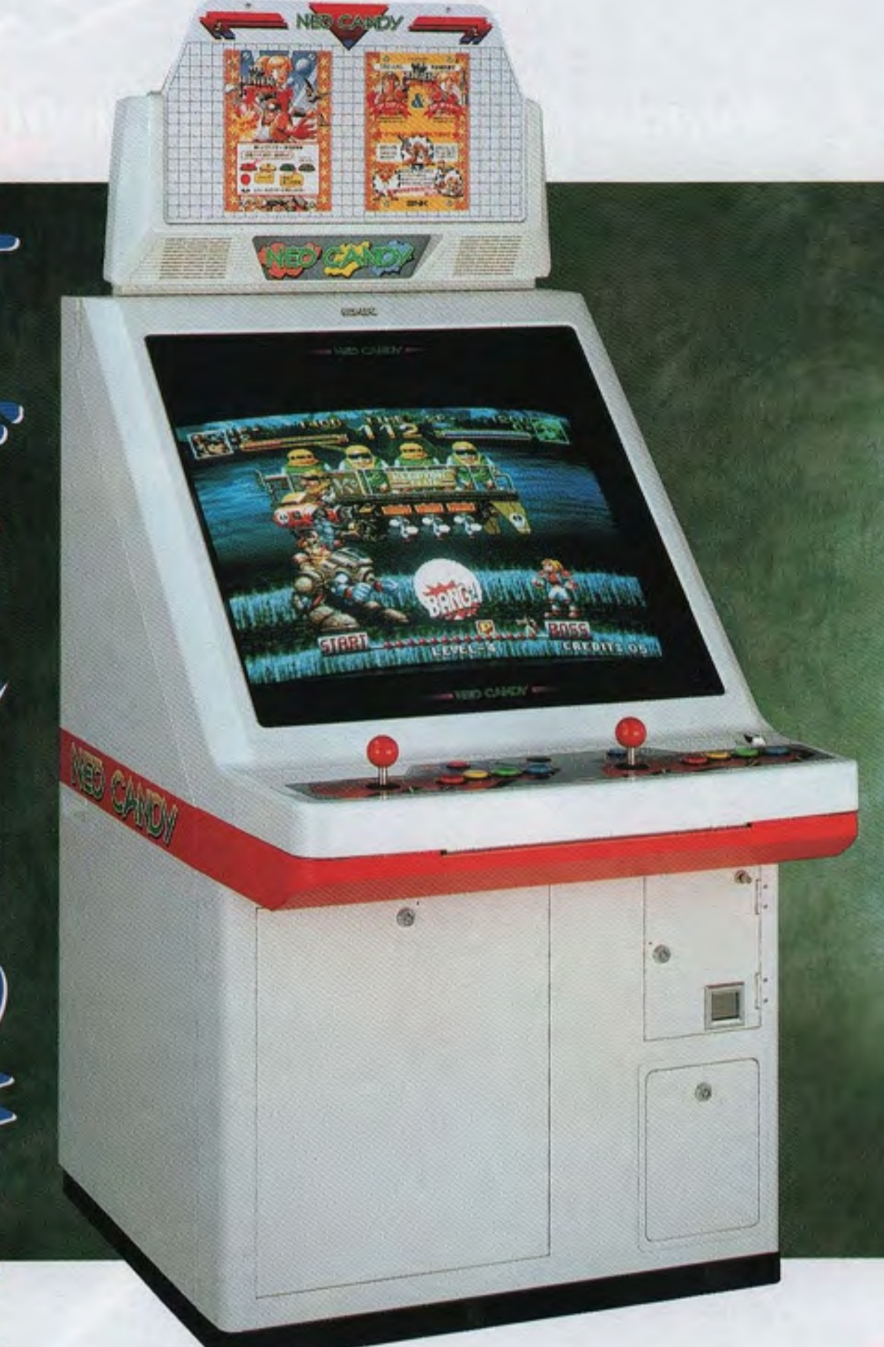
NEO CANDY29 JAMMA SPECIFICATIONS 29-INCH TYPE

●同一デザイン&JAMMA仕様。 大好評のキャンディ筐体がさらに充実。最新ネオジオ筐体と同一のデザインで店内を美しく演出する29インチ大画面モニター搭載のJAMMA仕様の筐体です。