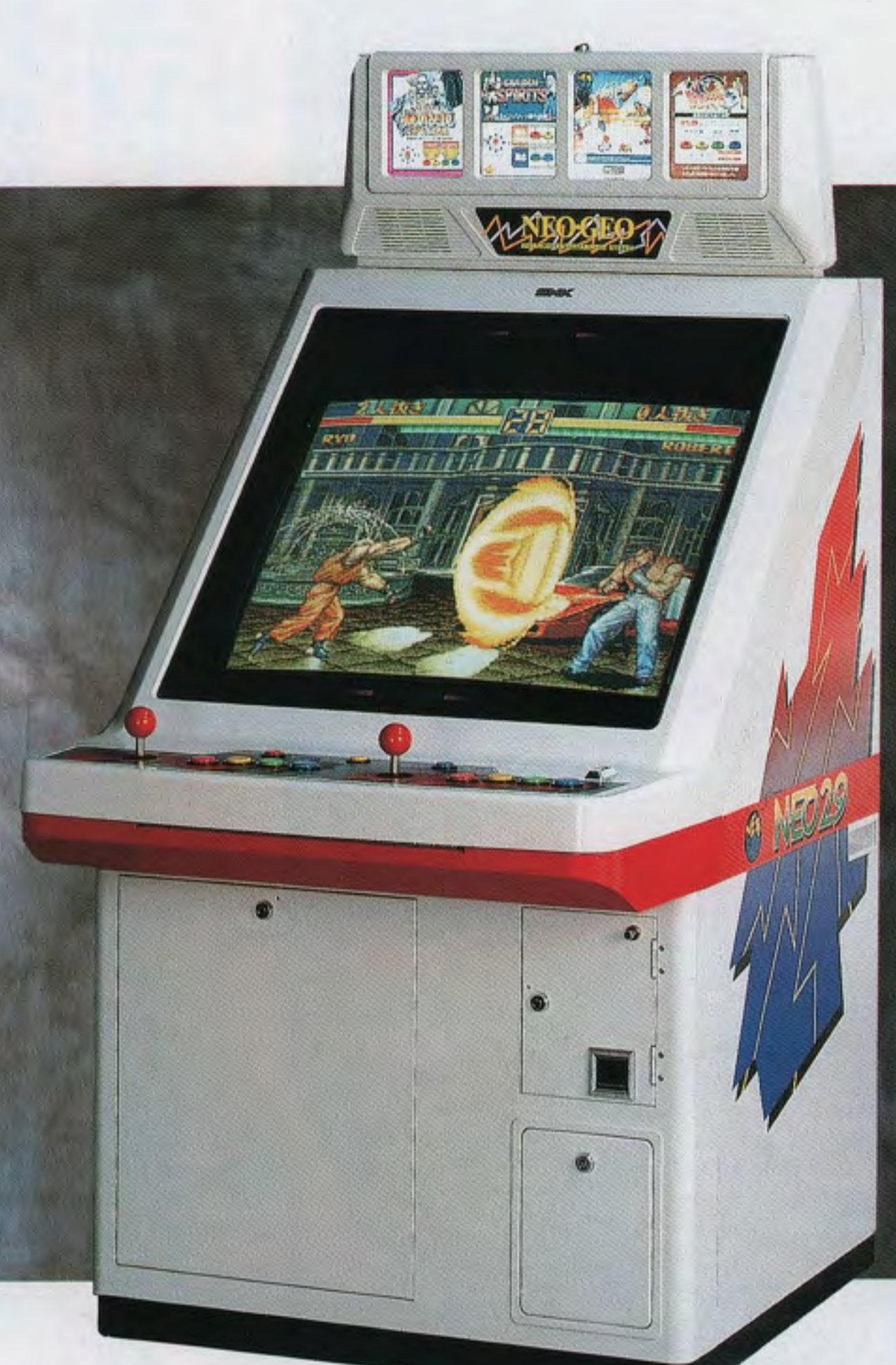
NEO29 MULTI VIDEO SYSTEM 4SLOT TYPE

●先進デザイン&ネオジオ仕様。 超人気のネオジオゲーム先進のデザインが、ロケーションを活性化し高収益を実現。 扱いやすく、耐久力・安全性ともに抜群のネオジオ専用4本用筐体です。