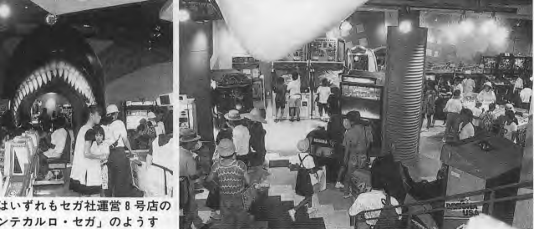
写真はいずれもセガ社運営8号店の「モンテカルロ・セガ」の様子

「フライ」 「ライ」 「ベ」 など遊園施設約二十種類のほかに、小乗物機約三十台、カーニバルおよびゲームコーナーがある。