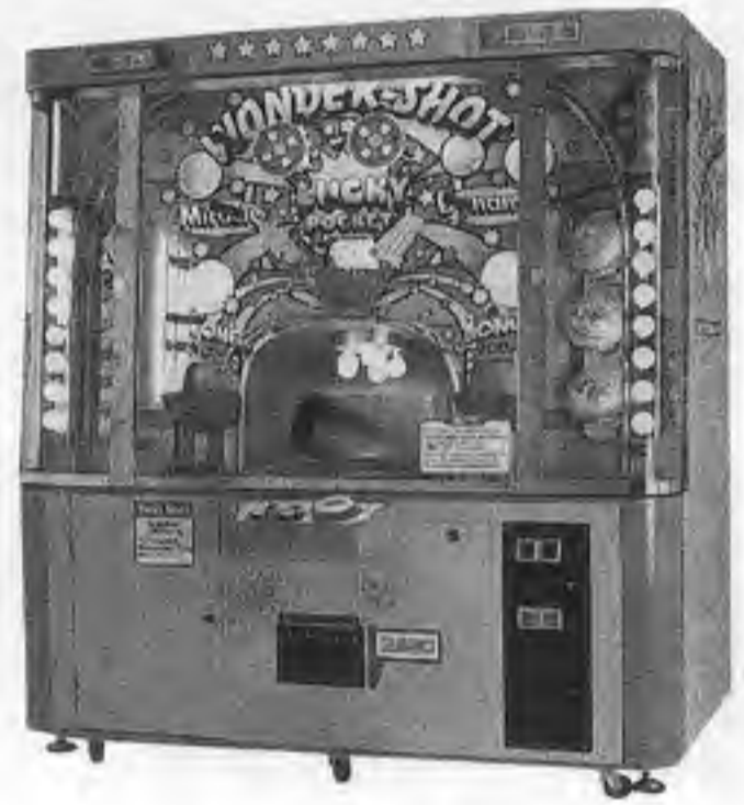
ワンダーショット