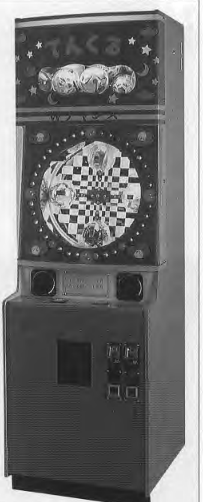
特許・実用新案出願中