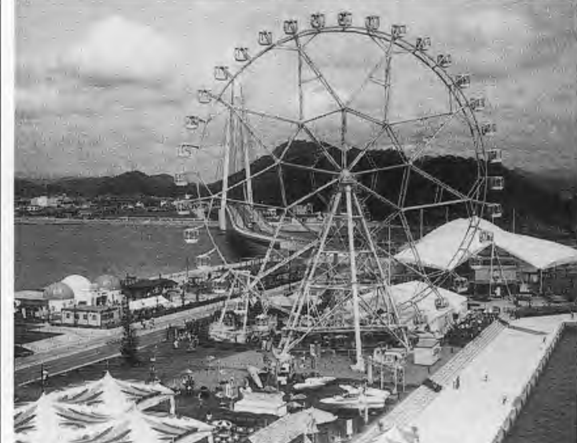
写真は上下とも「プレイランド」にて。上は高さ50メートルの観覧車「ジャイアントホイール」など。下は「ミニコースター」、2層式「メリーゴーランド」や「フライングカーペット」