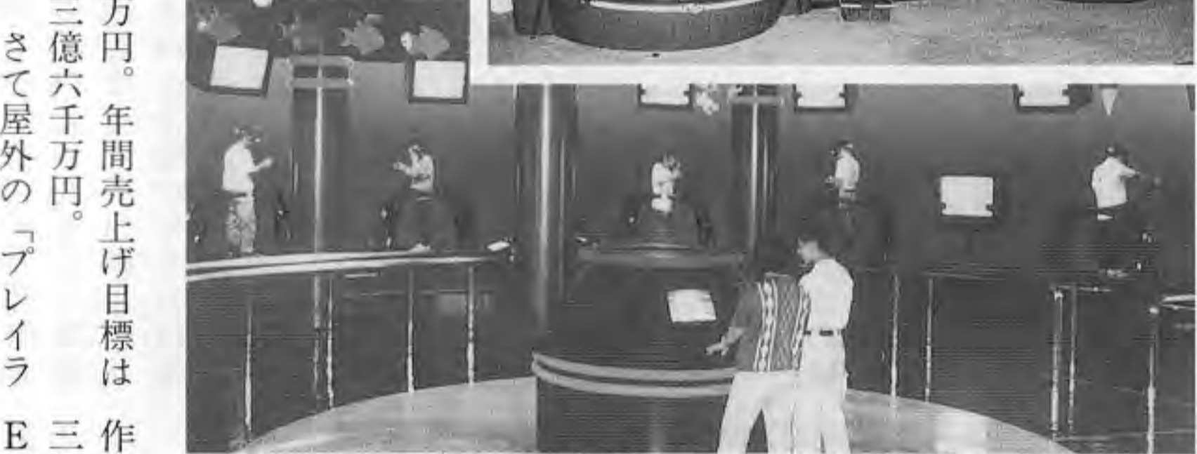
VRゲーム機「バーチャリティ2000SU」を使った施設「VR」にて

「フライ」 「ライ」 「ベ」 など遊園施設約二十種類のほかに、小乗物機約三十台、カーニバルおよびゲームコーナーがある。