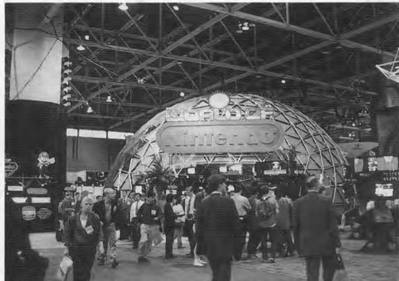
米国任天堂の巨大なブースのうち、上の写真はメインとなっているドーム。下はシリコングラフィクス社(SGI)のCG技術などを紹介しているコーナーの様子