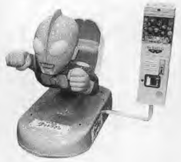
いけいけシリーズ・ウルトラマン