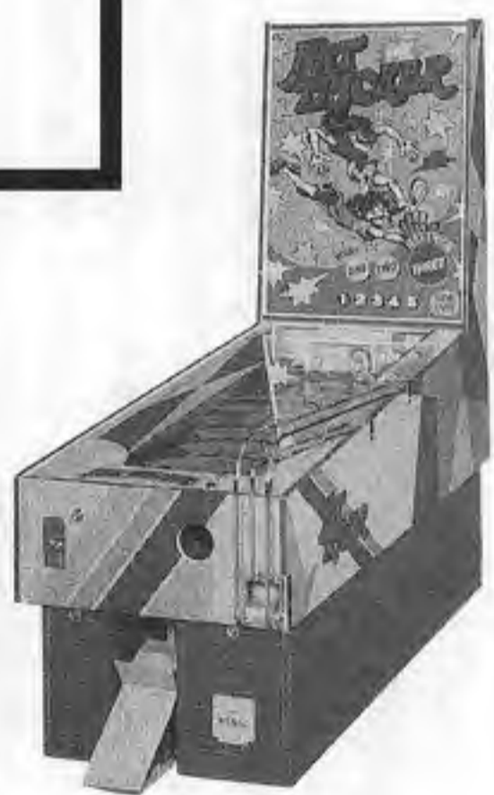
ハットトリッカーPK・P2