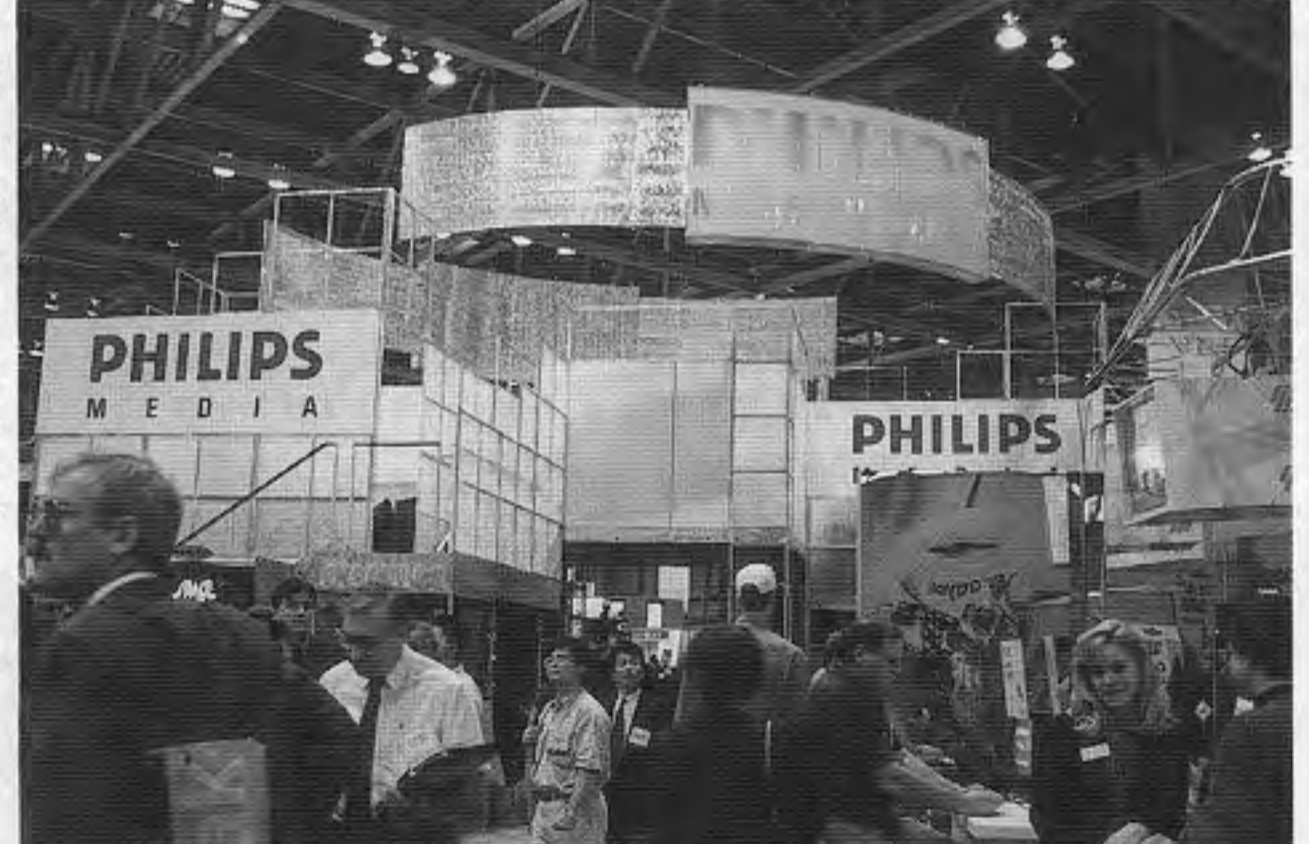
上はアタリコープ、下はフィリップス・メディア社の出展の様子