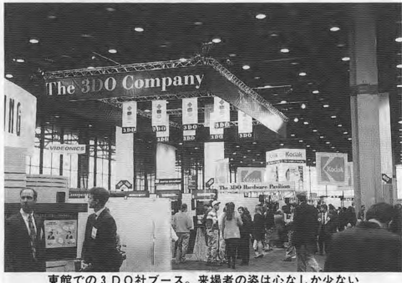
東館での3DO社ブース。来場者の姿は心なしが少ない

任天堂の64ビット機「ウルトラ64」の開発は、今秋業務用出荷を予定し、来年秋に家庭用出荷を始めるという。64ビット機の紹介である。特に同社は64ビット機用ゲームソフトを初めて披露する、と