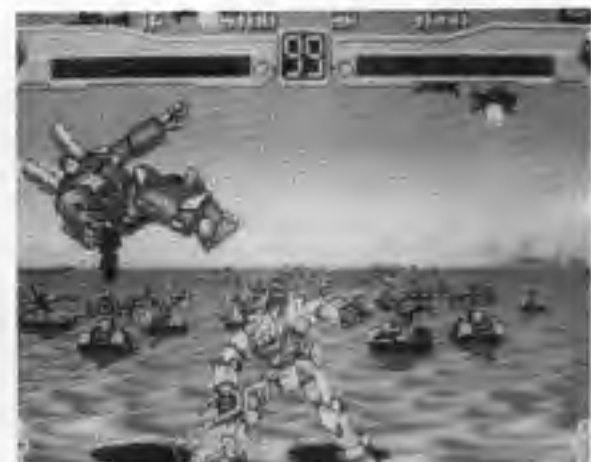
機動戦士ガンダム・エクスレビュー