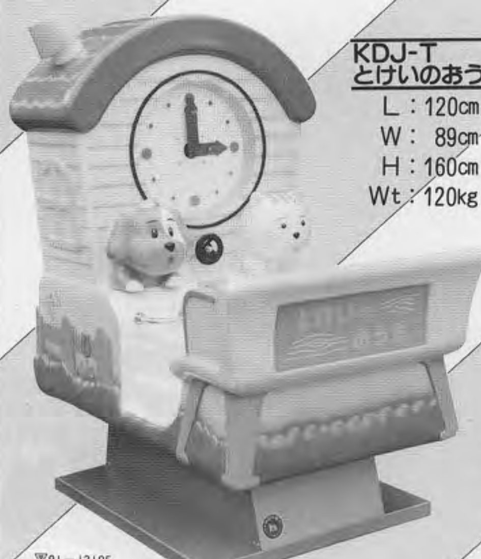
KDJ-T とけいのおうち L: 120cm W: 89cm H: 160cm Wt: 120kg