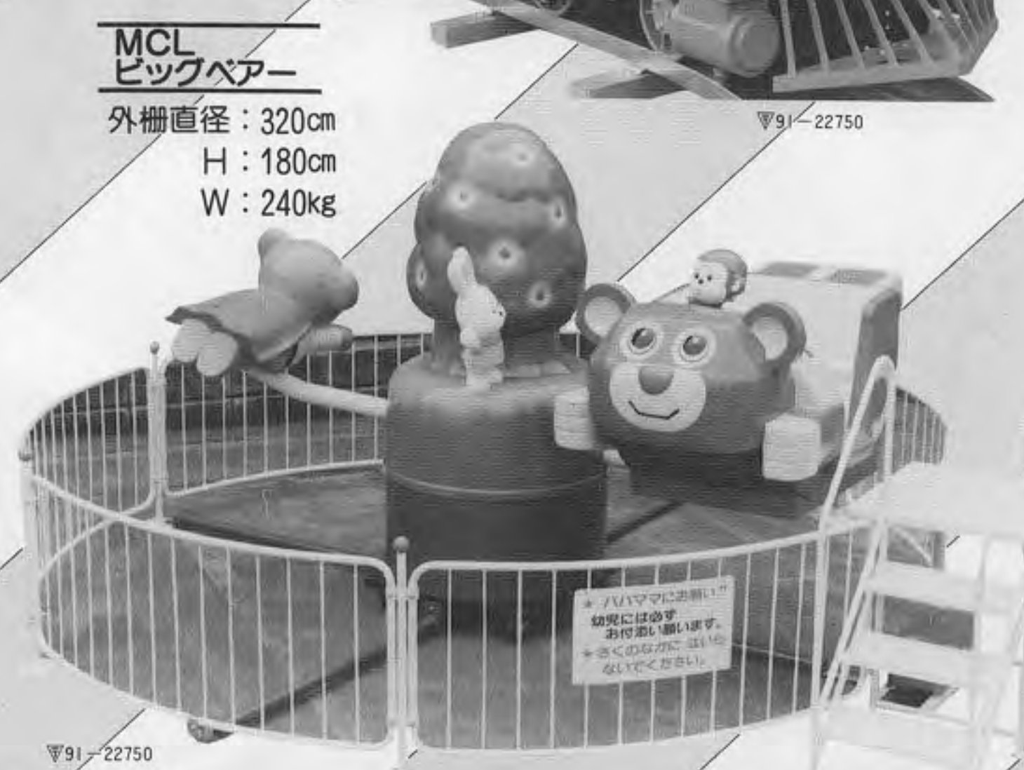
MCL ピックベアー 外柵直径: 320cm H: 180cm W: 240kg