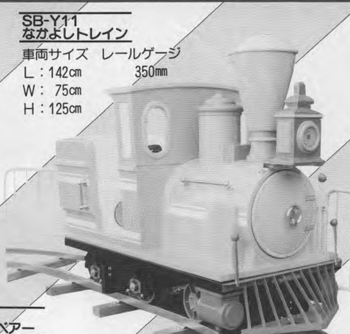
SB-Y11 なかよしトレイン 車両サイズ レールゲージ L: 142cm 350mm W: 75cm H: 125cm