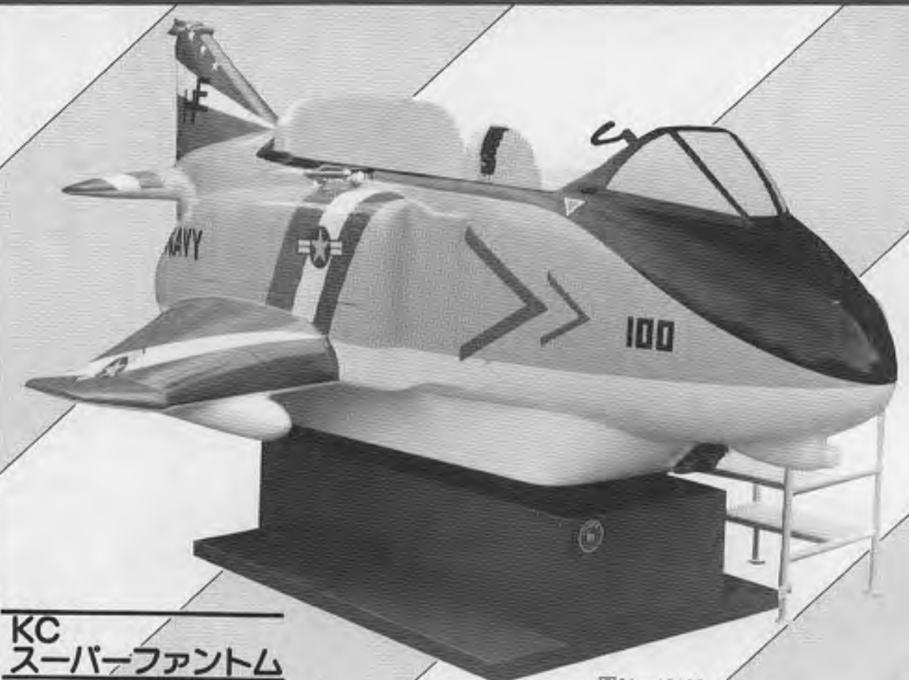
KC スーパーファントム L: 270cm W: 150cm H: 151cm Wt: 150kg 3人乗り